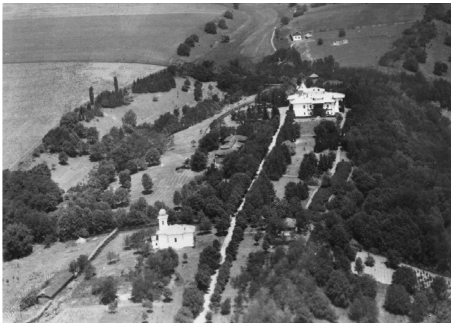
Fig. 21. Imagine aeriană a conacului Sturdza din Cristești (județul Iași)