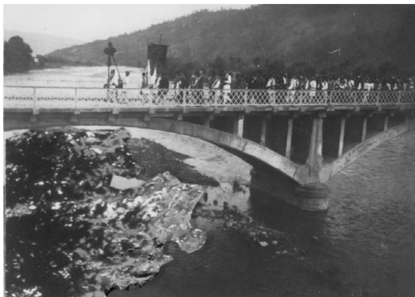
Fig. 27. Înfirmântarea lui Dimitrie M. Sturdza (1938)