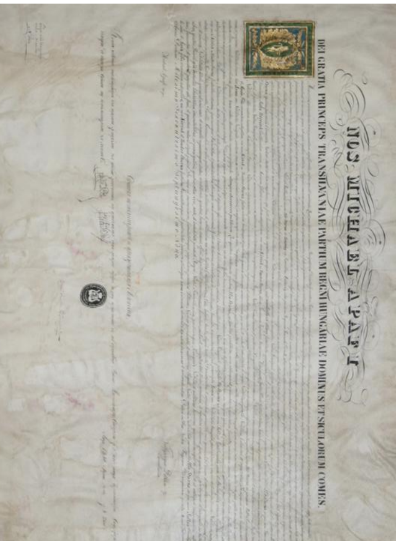
Fig. 2. Diploma de înobilizare conferită familiei Sturdza în 1679 de către Mihai Apafi I, principele Transilvaniei (copie 1840)