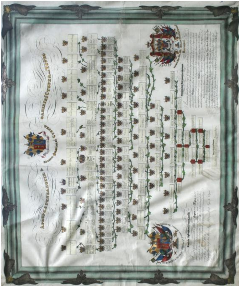
Fig. 3. Arborele genealogic al familiei Sturdza (1842)