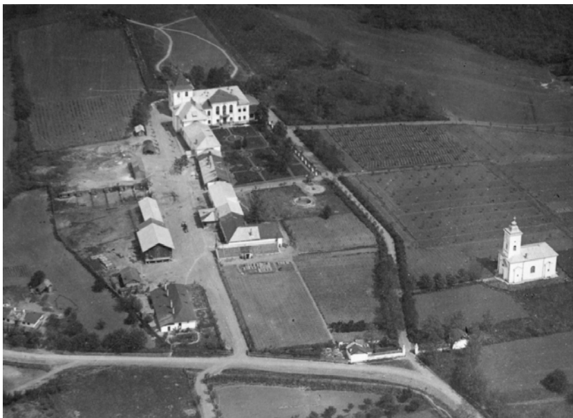
Fig. 20. Conacul Mavrocordat-Sturdza din Miroslava (județul Iași). Imagine aeriană a domeniului și fațada principală a conacului