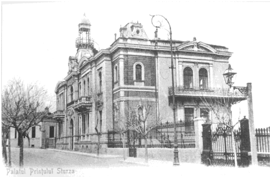
Fig. 16. Reședința din Constanța a lui Grigore M. Sturdza