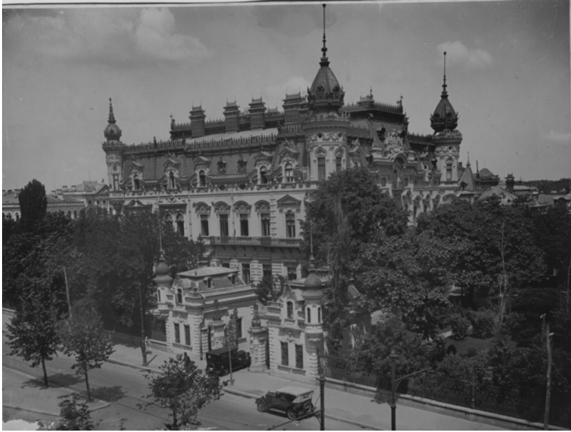
Fig. 15. Palatul din București al lui Grigore M. Sturdza