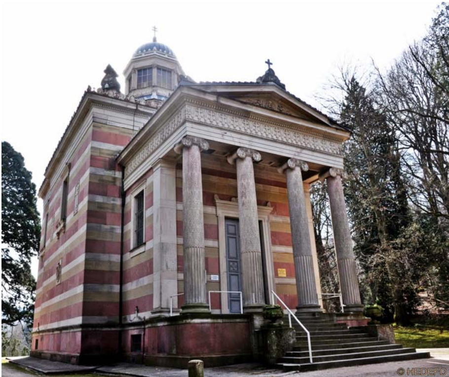
Fig. 6. Capela ridicată de către domnitorul Mihail Sturdza la Baden-Baden (Germania)