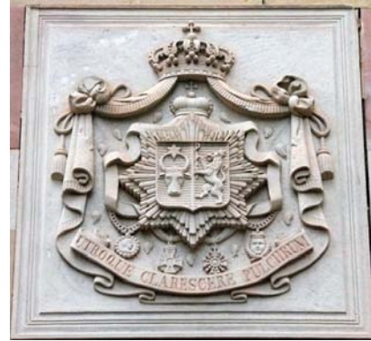
Fig. 5. Blazonul Sturdza de pe Capela din Baden-Baden