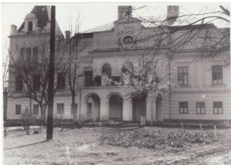
Fig. 29. Imagine din anul 1960 a conacului Cantacuzino-Pășcanu-Sturdza din Popești (județul Iași).