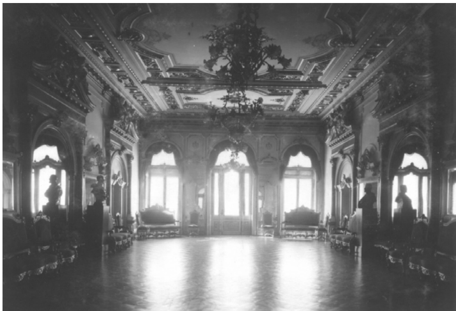
Fig. 17. Două dintre saloanele palatului Sturdza din București, devenit sediu al Ministerului Afacerilor Străine.