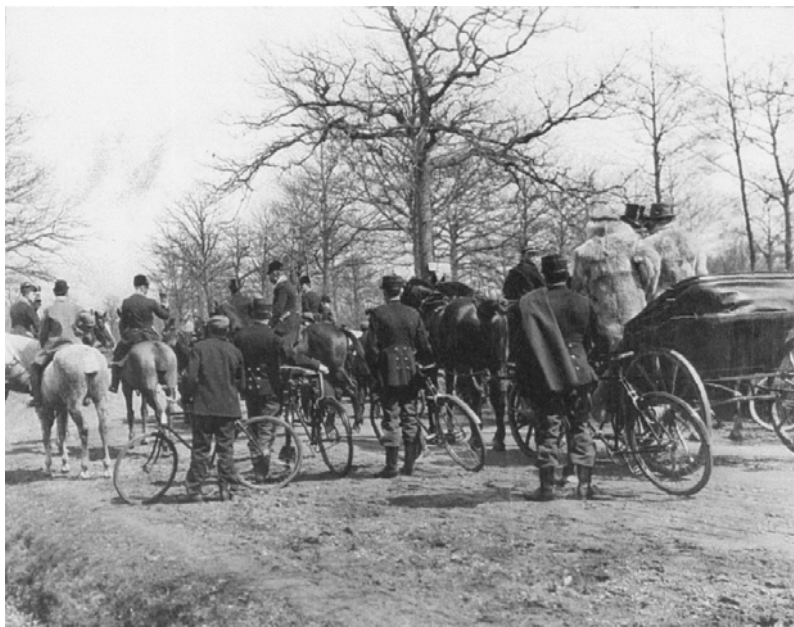
Fig. 28. O vânătoare la moșia Sturdza din Hangu (județul Neamț)