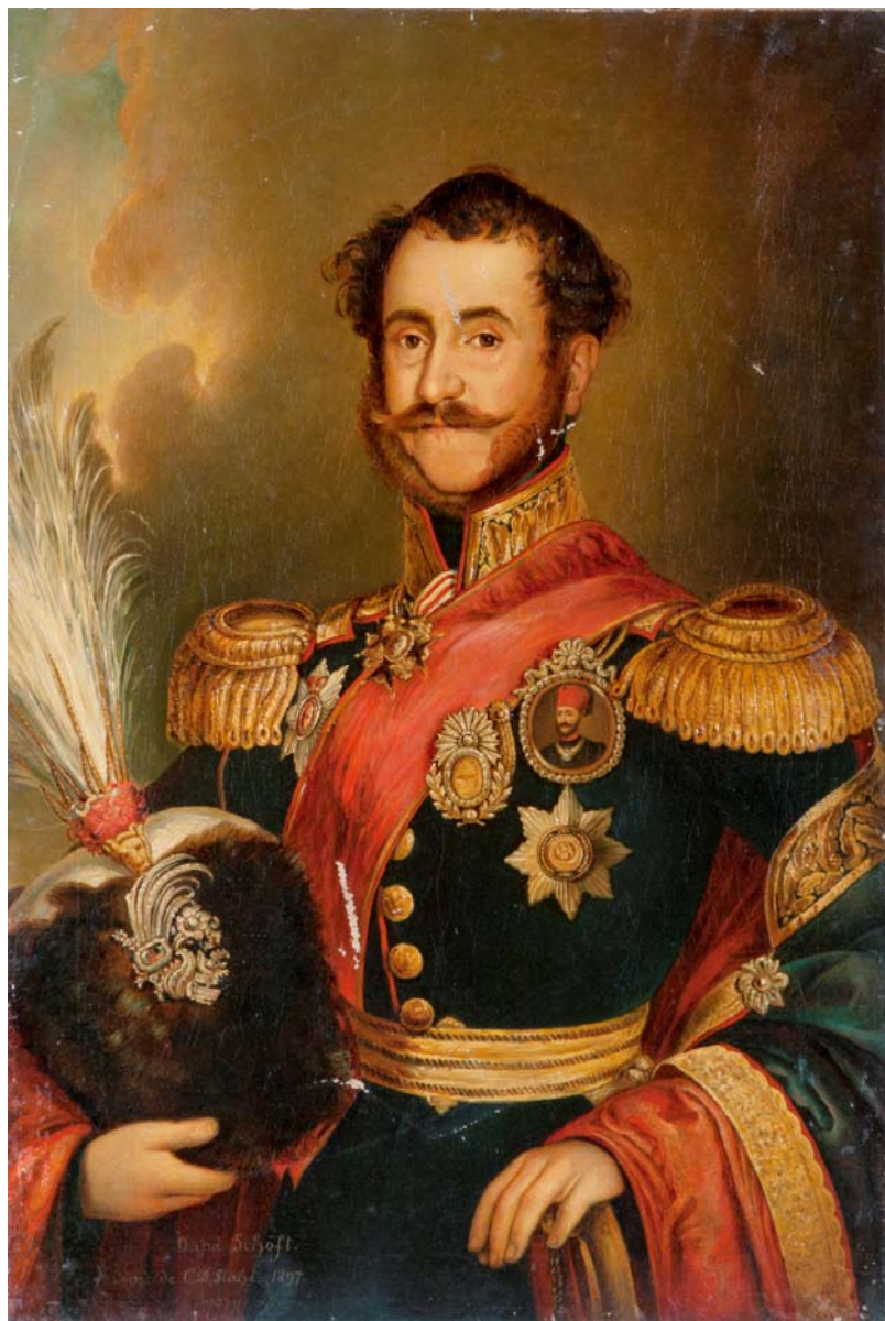
Fig. 1. Domnitorul Mihail Sturdza. Tablou de C. D. Stahi din 1897. Copie după portretul realizat de Josef August Schoefft (Deținător: Complexul Muzeal Național „Moldova” - Iași. Muzeul de Artă)