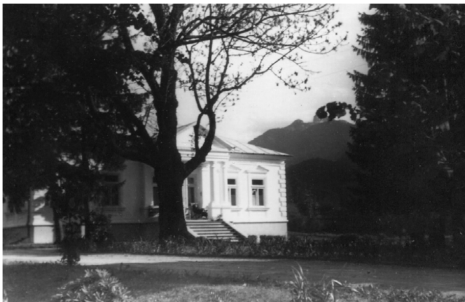
Fig. 23. Imagini de epocă ale conacului Sturdza din Hangu (județul Neamț), demolat în timpul lucrărilor de construire a barajului de la Bicăz