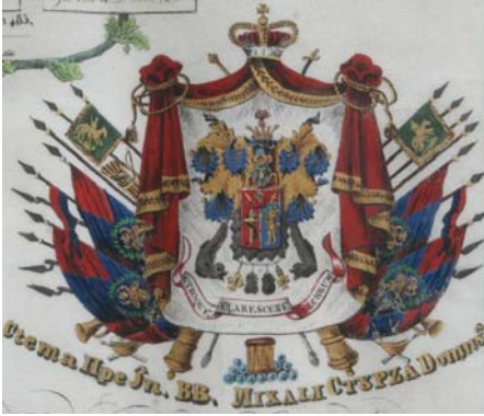
Fig. 4. Stema domnitorului Mihail Sturdza (1842)