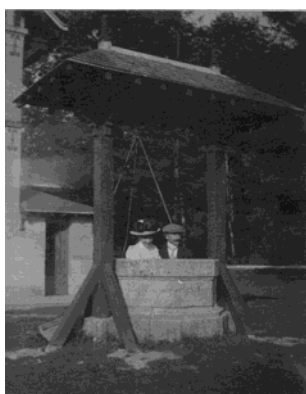
Fig. 12. Imagini de epocă ale reședinței din Dieppe (Franța) a lui Dimitrie M. Sturdza. Clădirea a fost distrusă în timpul bombardamentelor din 1942