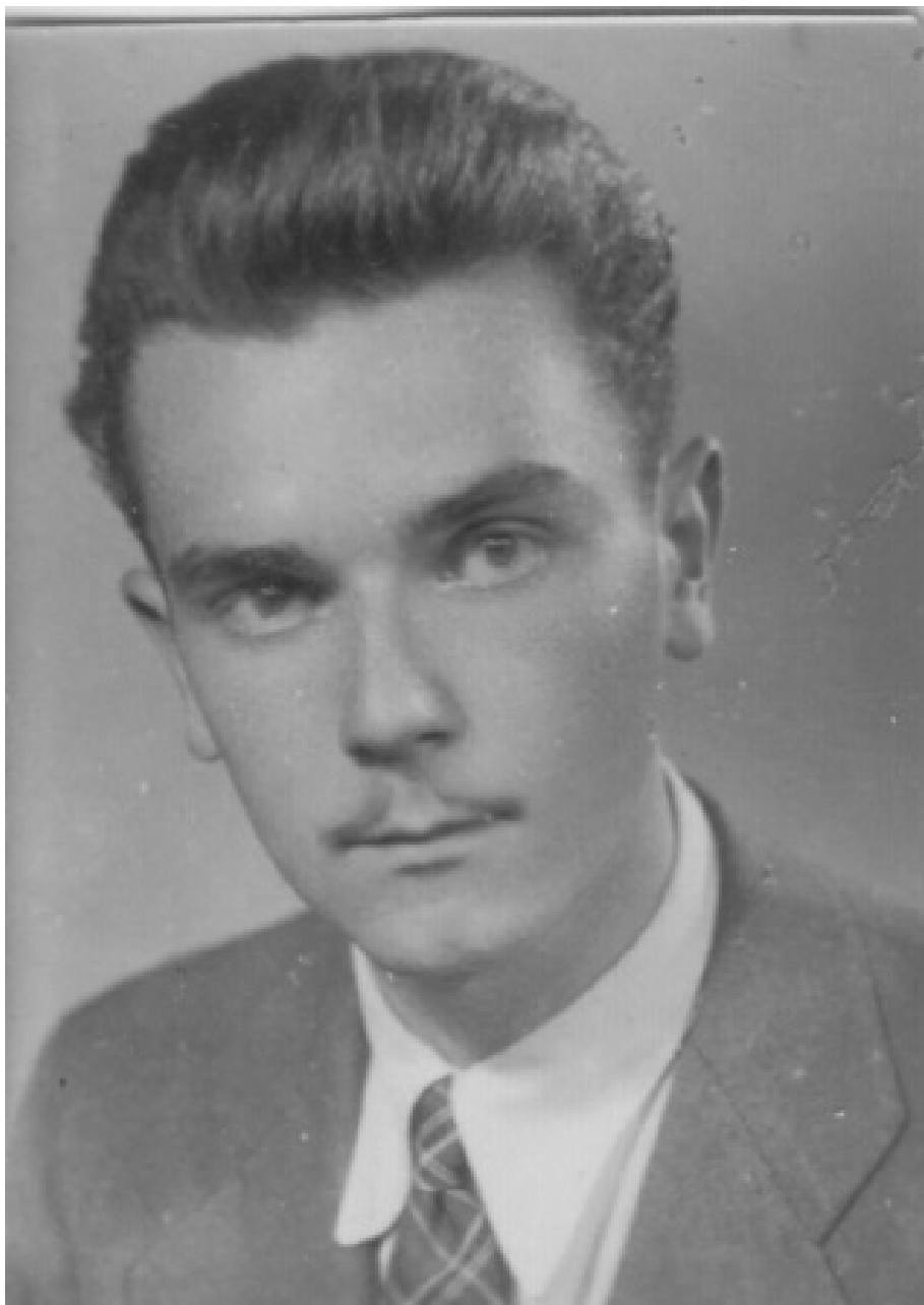
Fig. 30. Mihai Dim. Sturdza – fotografie din 1952, cu puțin timp înainte de arestare