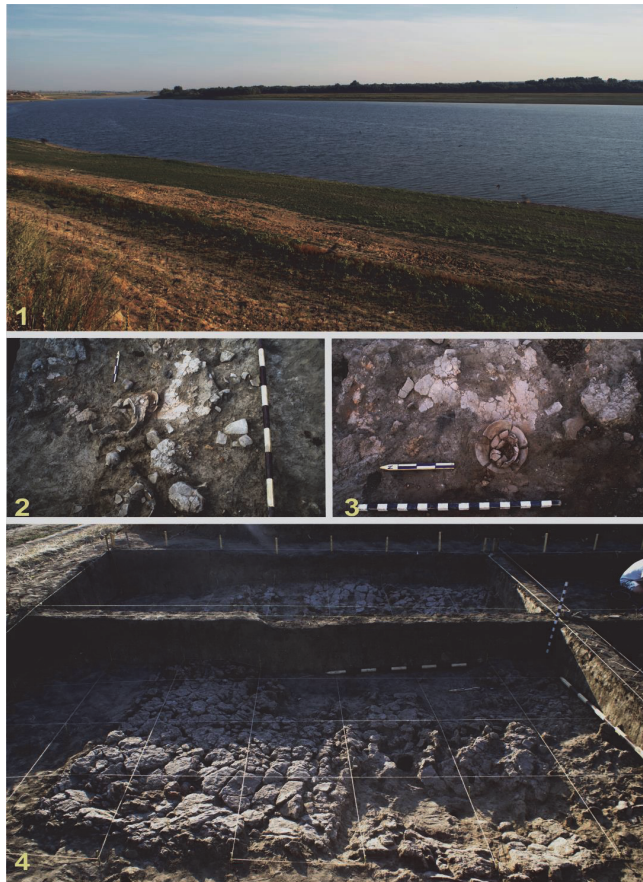
Fig. 2. Ripiceni - Holm. 1. Prutul mijlociu în dreptul sitului; 2-4. Detalii ale locuinței 4/2015 14

Prin săpături arheologice (385 m 2 ), au fost investigate locuințele din cel mai bogat nivel de ocupare, Cucuteni A-B 1 (cca. 4200-4100 BC): L 1/2010 (în SI și SII), L 2 și L 3/2012 (în cas. I, 9 x 11 m), L 4/2015 (în cas. II, 10 x 10 m), L 5-7/2016 (în secțiunea IV/2016, 35 x 3 m), dar au fost evidențiate dovezi de locuire și de la sfârșitul epocii bronzului (Cultura Noua, faza a II-a, cca. 1400-1200 BC), de la începutul epocii fierului (Cultura Hallstatt-ului canelat est-carpatic, Grupul Corlăteni, cca. 1200-1000 BC) și din Cultura Sântana de Mureș-Černjachov (sec. III-IV p. Chr.).