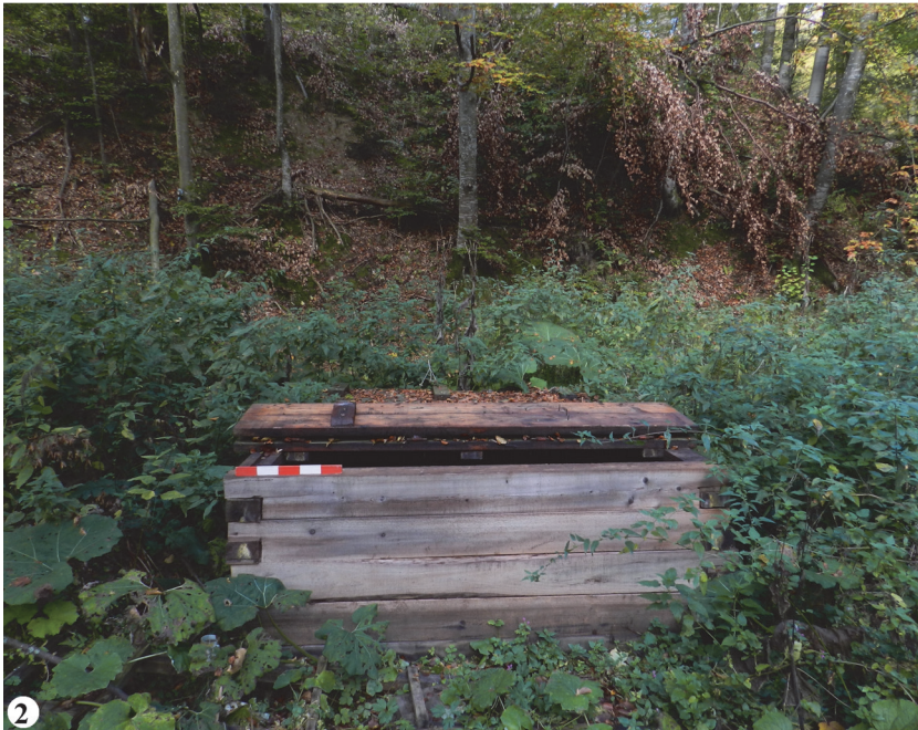
Fig. 2. 1, Izvor sărat de la Bălțatești - Slatina A ; 2, Izvorul sulfuros de la Mănăstirea Neamț - Puturosul