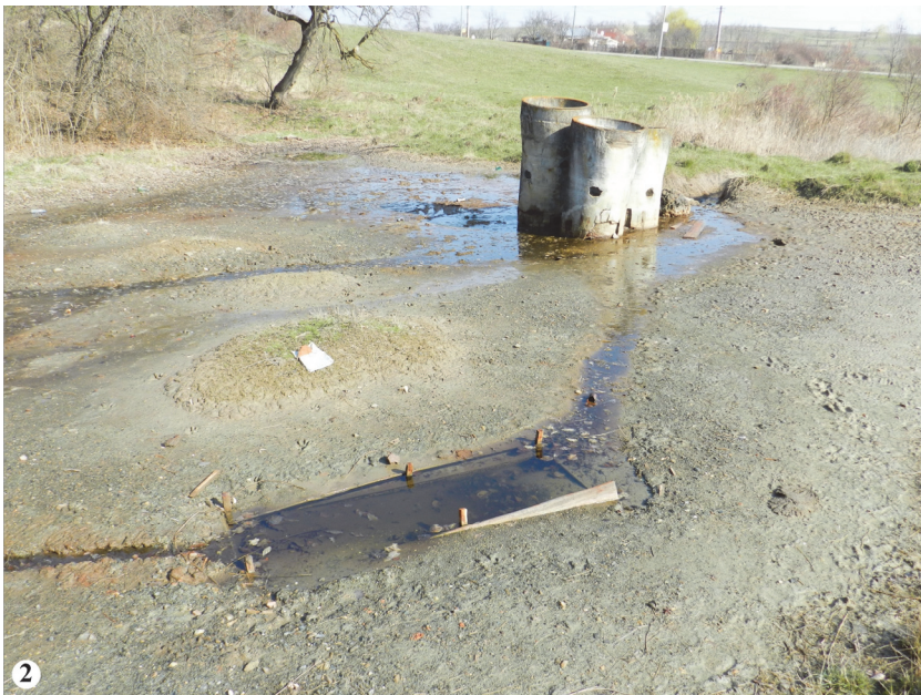
Fig. 4. 1, Izvorul sărat de la Oglinzi - Băi ; 2, Izvorul sărat de la Oglinzi - Fântâna Corugea