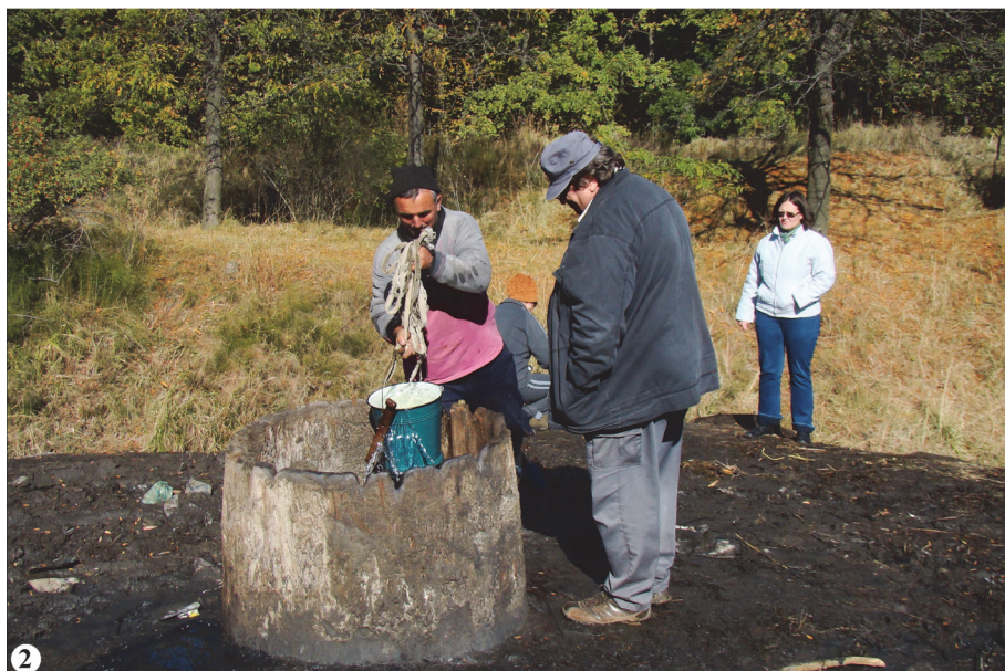
Fig. 1. 1, Localizarea izvoarelor sărate și sulfuroase de la Oglinzi, Lunca și Mănăstirea Neamț; 2, Izvorul de slatină de la Lunca