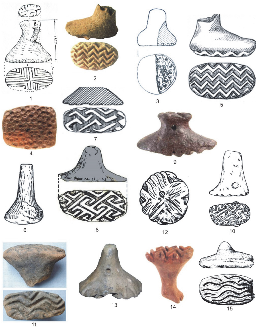
Fig. 1. Pintadere Starčevo-Criș: 1. Bursuci, 2. Copăcelu, 3-4. Gura Baciului, 5. Gura Văii, 6-7. Perieni, 8. Poienești, 9. Tășnad, 10. Trestiana, 11. Suplacu de Barcău, 12. Verbița, 13-14. Zăuan, 15. Beșenova Veche (după: 1. Coman, 2. Tulugea, 3-4. Lazarovici, 5. Dumitrescu, 6-7. Petrescu-Dîmbovița, 8. Lazăr, 9-10. Popușoi, 11. Lazarovici, 12. Berciu, 13-15 Makkay; scări diferite)