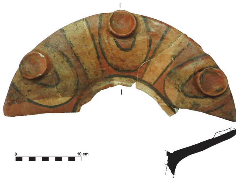
Fig. 2. Răucești - Dealul Munteni, fragment de vas de tip kernos