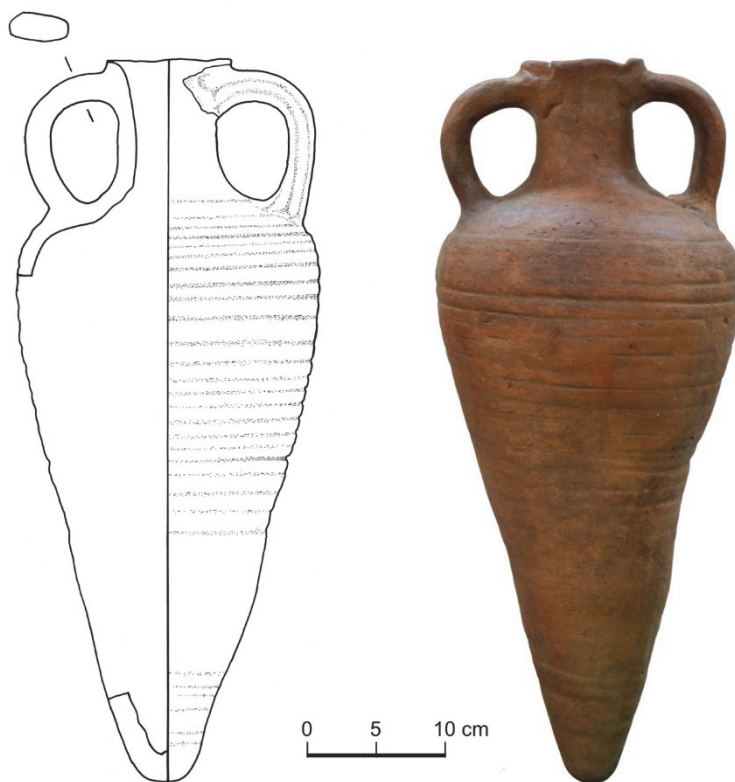
Fig. 3. The amphora discovered at Zaboloteni (drawing and photo)