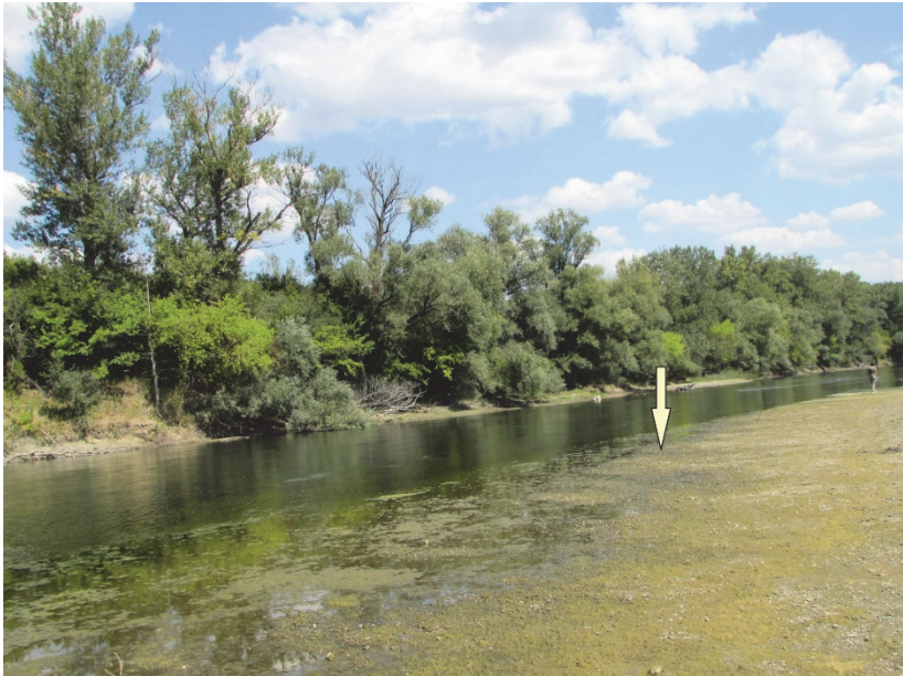
Fig. 2. The channel of the Prut and the point where the vessel was retrieved