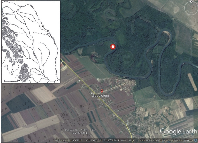
Fig. 1. Map location of the discovery (Map support: Google Earth)