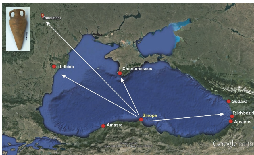
Fig. 5. The geographical distribution of Type D Snp II Sinopean amphoras (Map support: Google Earth)