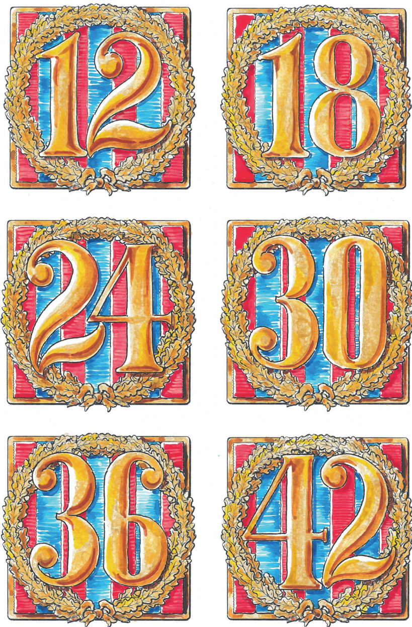
Fig. 7. „Semnului Distenției a Neprihănitei Slujbe”, pentru 12, 18, 24, 30, 36 și 42 de ani de slujbe – reconstituirea autorului