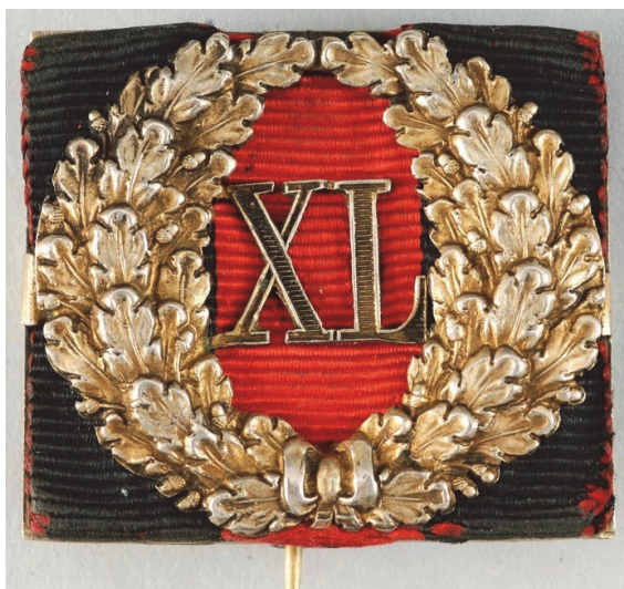
Fig. 4. „Semnul de Distincție pentru Serviciu Impecabil” (Imperiul Rus, model 1827), varianta pentru civili, pentru 40 de ani de slujbe http://medalirus.ru/rus-ordena/znaki-otlichiya-za-sluzhbu.php