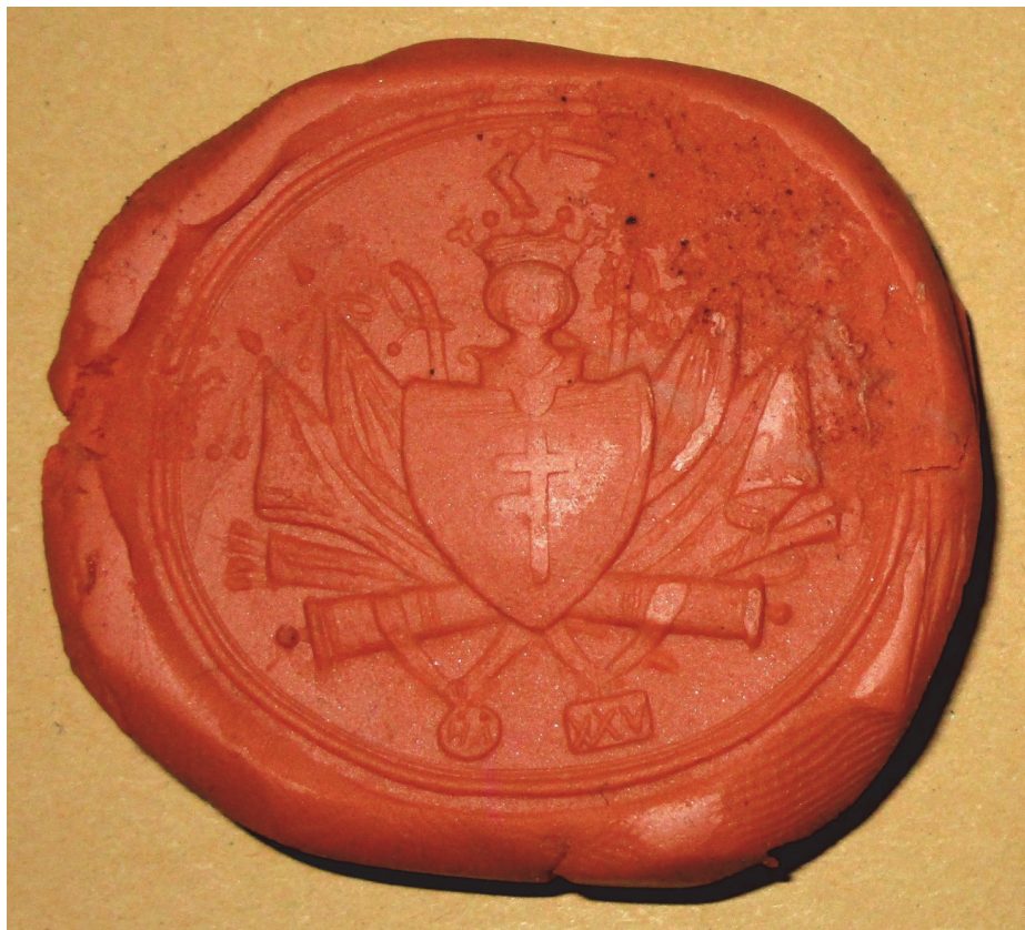
Fig. 6. Modul de reprezentare a „Semnului de Distincție pentru Serviciu Impecabil” (Imperiul Rus, model 1827) în heraldică: pecetea unui ofițer necunoscut, redând herbul „Prus I”, de care atârână, la dextra, medalia „Pentru apărarea Sevastopolului” (1855) sau „În amintirea războiului 1853-1856” (1856), respectiv, la senestra, „Semnul de Distincție pentru Serviciu Impecabil”, pentru 25 de ani de slujbe – Arhivele Naționale Istorice Centrale, Matrice sigilare , nr. 13.737 (matrice din fier, de pe la mijlocul secolului al XIX-lea, având dimensiunile cca. 23 x 25 mm)