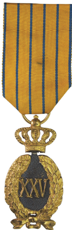
Fig. 9. „Semnul Onorific” pentru 25 de ani de serviciu militar (model 1872) – colecția Muzeului Național de Istorie a României, nr. inv. 116.610