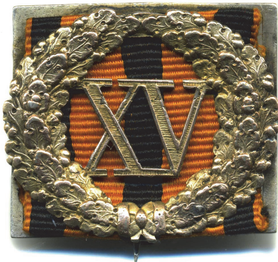
Fig. 3. „Semnul de Distincție pentru Serviciu Impecabil” (Imperiul Rus, model 1827), varianta pentru militari, pentru 15 ani de slujbe http://medalirus.ru/rus-ordena/znaki-otlichiya-za-sluzhbu.php