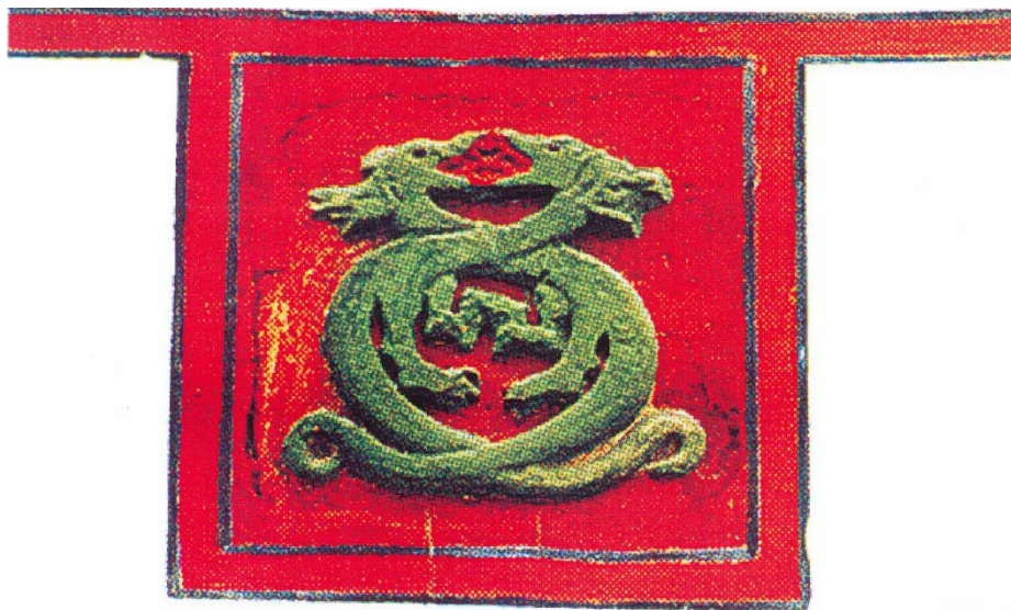
Fig. 5. Stema ghiraidă pe o pancartă (?)