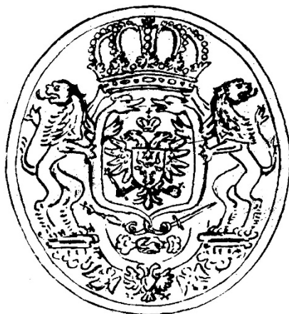
Fig. 1. Stema folosită de Dimitrie Cantemir în sigiliul din ianuarie 1722