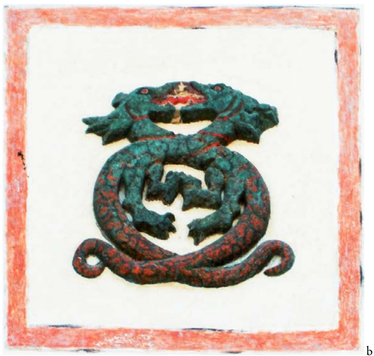
Fig. 4. Stema ghiraidă de deasupra porții de intrare la Baccisarai (a – vedere de ansamblu; b – detaliu)