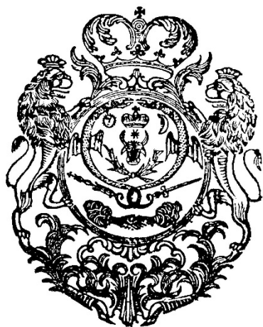
Fig. 2. Stema de pe frontispiciul Hronicului tipărit la Iași în 1835