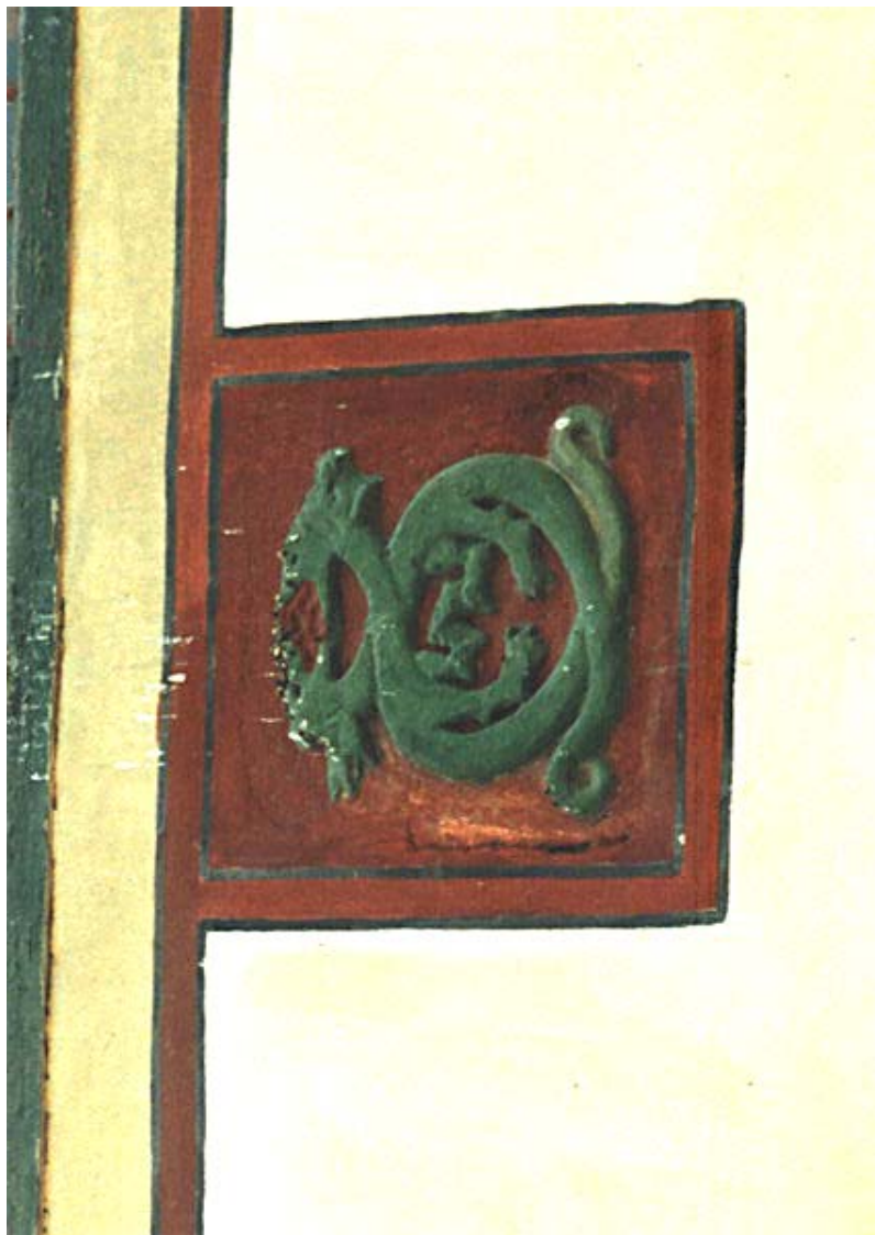
Fig. 7. Stema ghiraidă pe site-ul arheologia.narod.ru/krim/bach/htm