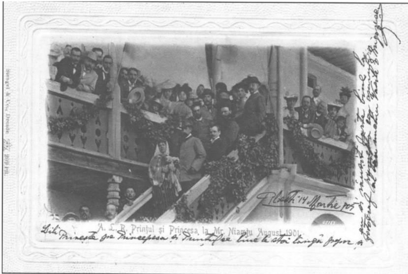
Fig. 3. Altețele Sale Regale Prințul Ferdinand și Principesa Maria la Mănăstirea Neamț, august 1901