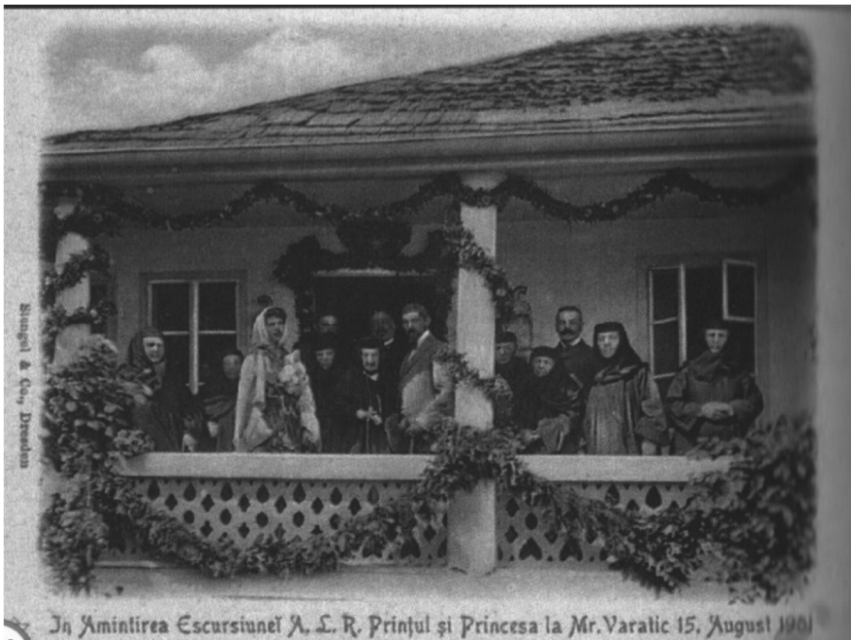
Fig. 4. Altețele Sale Regale Prințul Ferdinand și Principesa Maria la Mănăstirea Văratec, 15 august 1901 (sursa foto: C. Pașilea, V. Nicolau, D. Diaconu, Mănăstiri și schituri din județul Neamț. Cartea poștală ilustrată , 2013, p. 64)