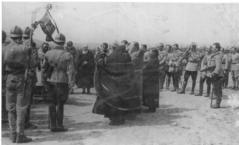
Fig. 9. Serviciul religios la Regimentul Vânătorilor de Munte în prezența Regelui Ferdinand, a Reginei Maria și a Princesei Mărioara