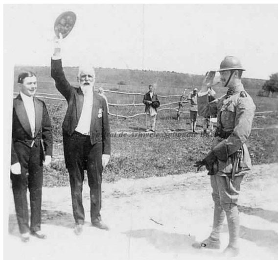
Fig. 6. Principele Carol și Ionel Brătianu la Târgu-Neamț