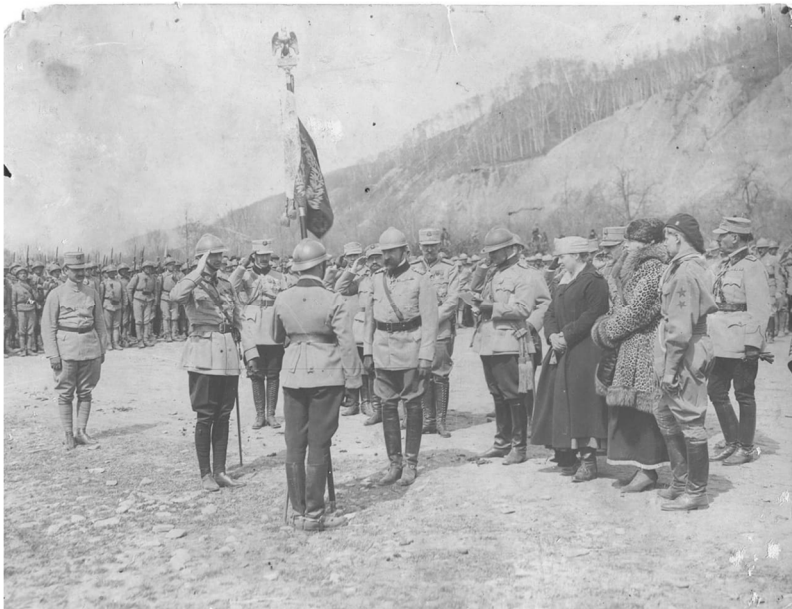
Fig. 8. Înmânarea drapelului primei unități de Vânători de Munte de către Regele Ferdinand, Târgu Neamț, 1917