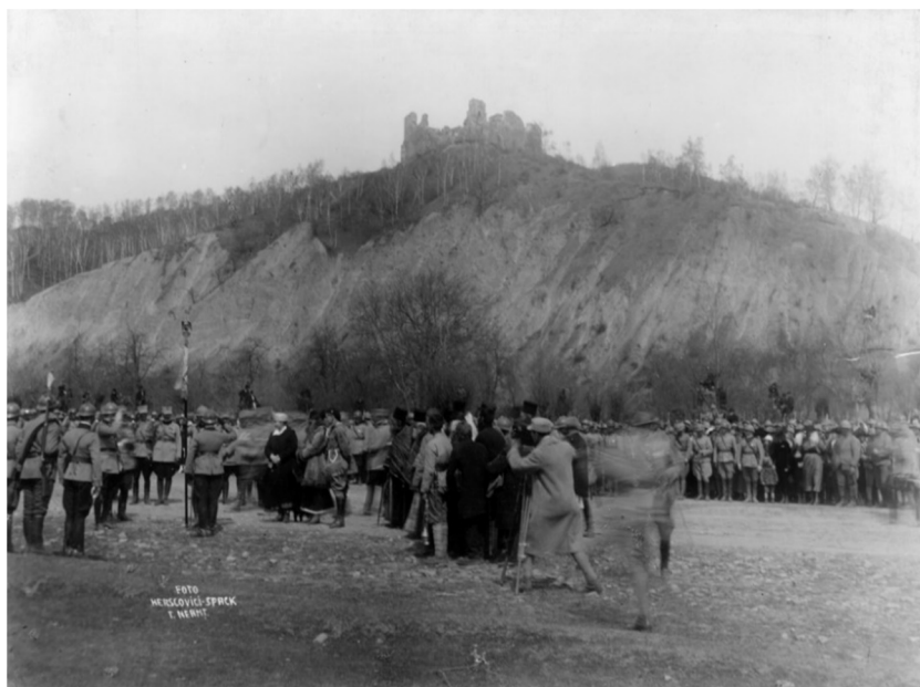
Fig. 10. Regele Ferdinand, Regina Maria, Princesea Elisabeta, Prințul Nicolae la ceremonia de înmănare a drapelului Batalionului Vânătorilor de Munte, satul Vânători, județul Neamț, 14 februarie 1918