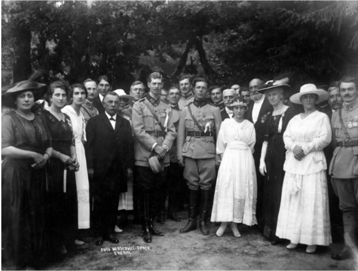
Fig. 7. Principele Carol invitat la celebrarea unei căsătorii, 1917 (sursa foto: Cota FOTO 55187, Biblioteca Națională a României, Colecții Speciale, Cabinetul de Fotografii)