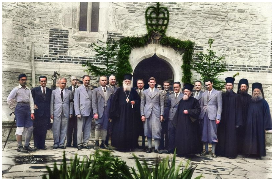
Fig. 11. Mihai I și suita sa alături de Mitropolitul Nicodim, 21 iunie 1939