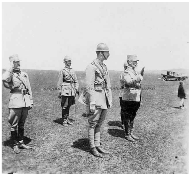
Fig. 5. Principele Carol alături de alți ofițeri la Târgu-Neamț