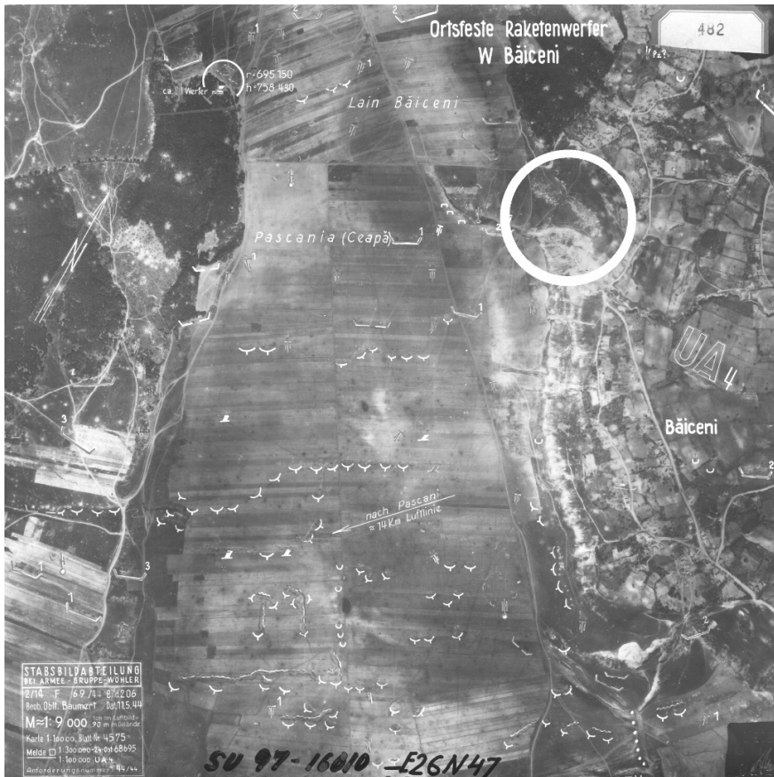
Fig. 2. Fotografia aeriană realizată de către armata germană în 11.05.1944 asupra zonei Baïceni, cu marcarea poziției Cetățuiei de la Cucuteni (în medalion)