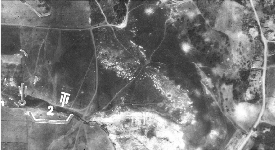
Fig. 5. Detaliu asupra zonei platoului pe care se află Cetățuia de la Cucuteni din fotografia aeriană realizată de către armata germană în 11.05.1944 asupra zonei Băiceni (Notă: Punctele albe reprezintă urmele bombardării zonei – cratere de obuze/bombe)