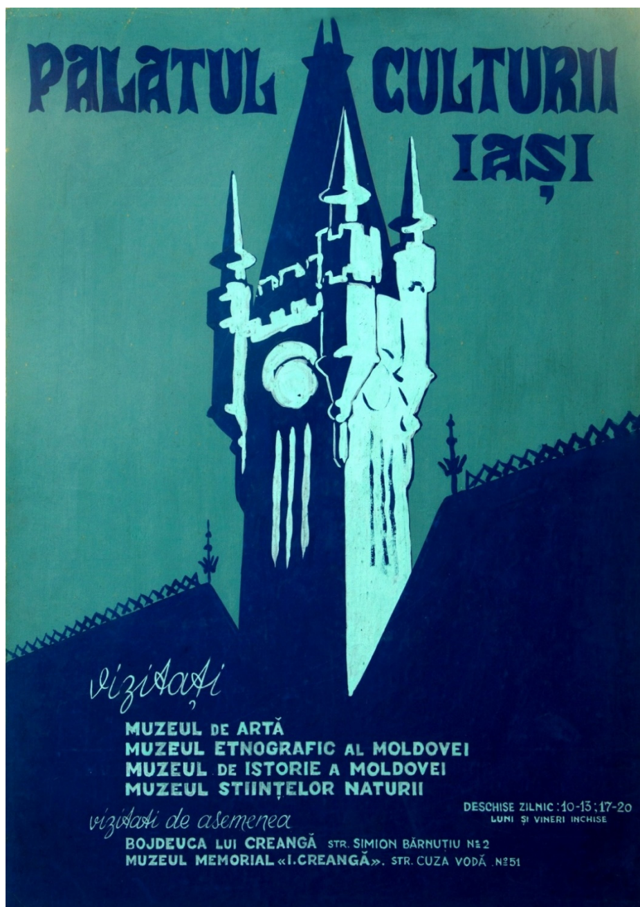
Figura 1. Afiş pentru mediatizarea muzeelor din Palatul Culturii