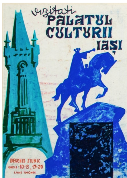
Figura 8. Afiș pentru Palatul Culturii