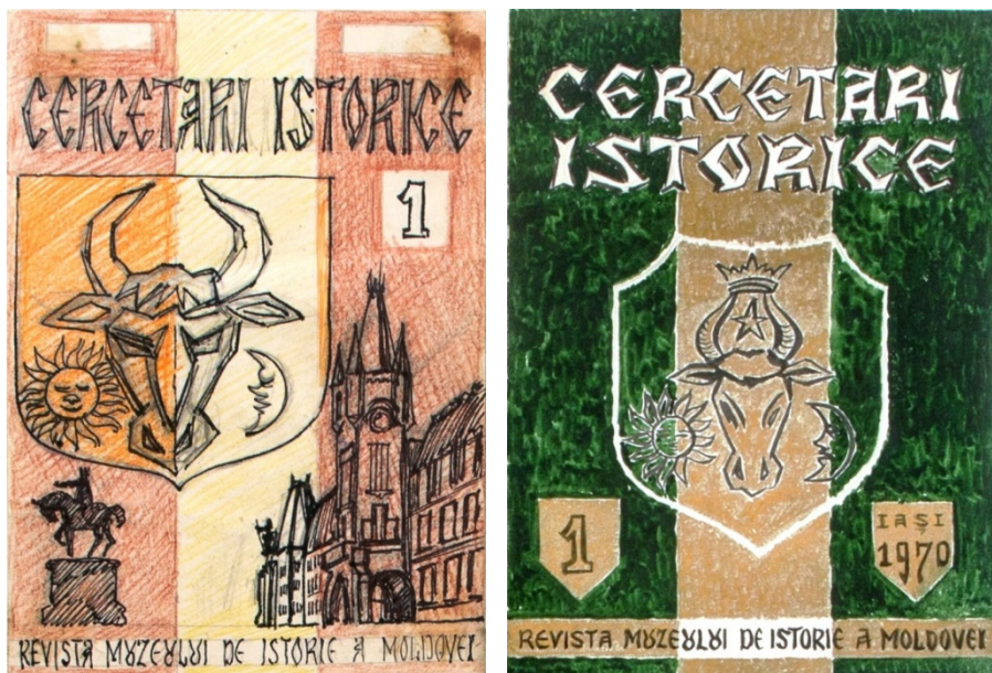
Figura 4. Proiecte pentru coperta revistei „Cercetări istorice” (1970)