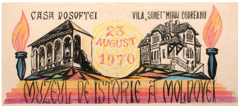
Figura 5. Popularizarea muzeelor din secția literară a Muzeului de Istorie