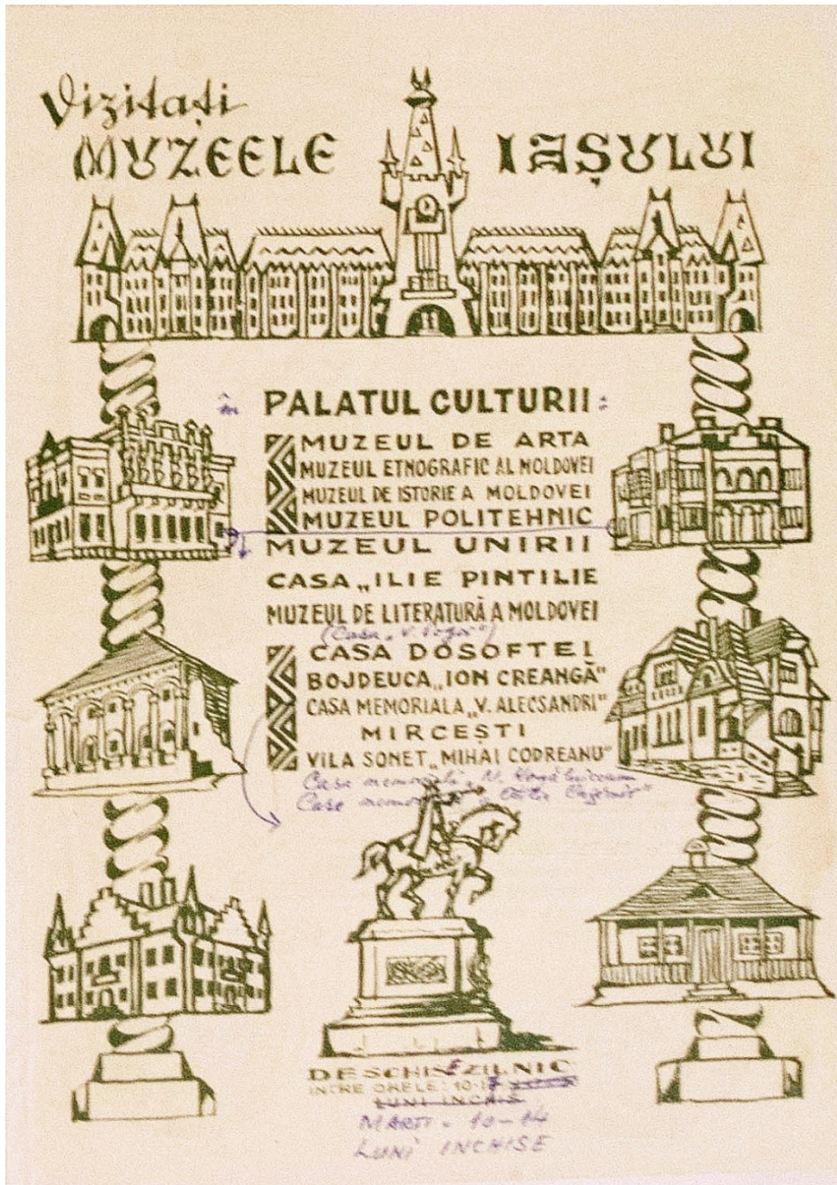
Figura 3. Afiş de popularizare a muzeelor din cadrul Palatului Culturii