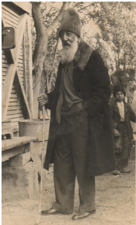
Fig. 11. Generalul Mihai L. Negruzzi în 1944. MNLR Iași