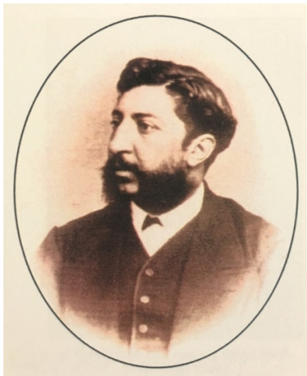
Fig. 7. Leon C. Negruzzi. MNLR Iași