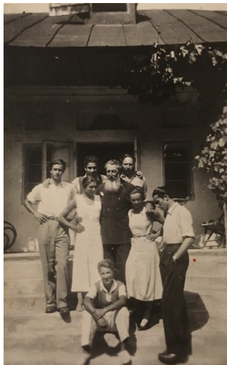
Fig. 12. Generalul Negruzzi alături de nepoții săi la conacul din Hermeziu (județul Iași).