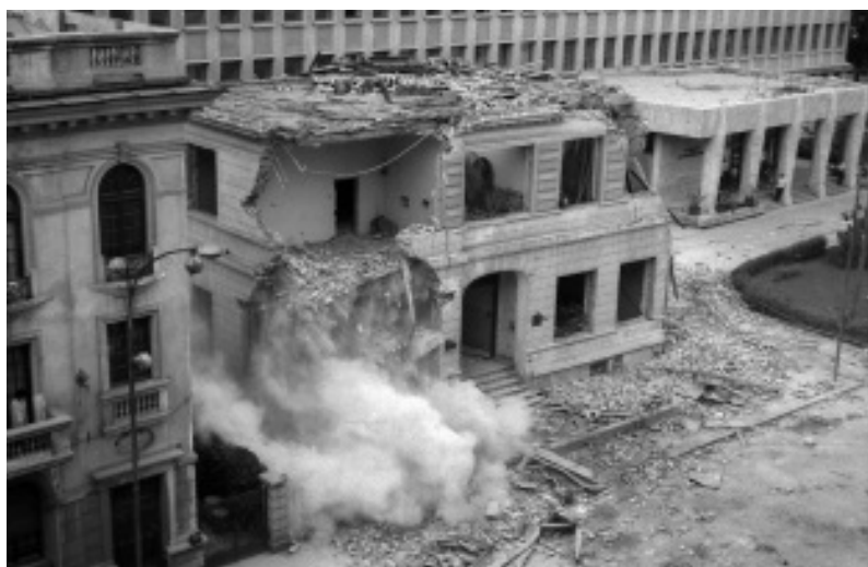
Fig. 22. Demolarea casei Negruzzi din București, 1974.