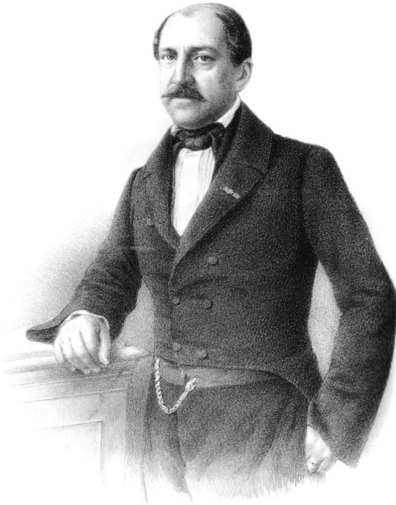
Fig. 6. Constantin Negruzzi. Litografie de Eduard Sieger. Colecția Muzeului Național al Literaturii Române din Iași (în continuare, MNLR Iași)