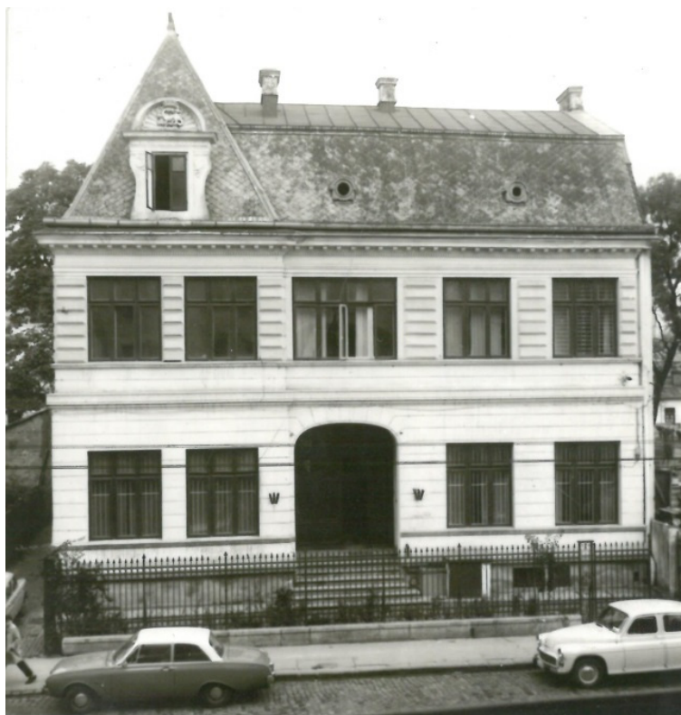
Fig. 21. Casa lui Iacob Negruzzi din București (strada Romană nr. 9), 1967.