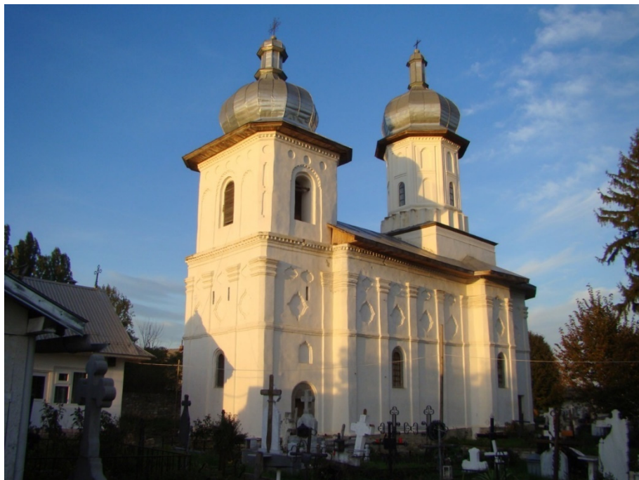
Fig. 2. Biserica „Adormirea Maicii Domnului” din Bălănești (județul Neamț), ctitorie a familiei Rosetti.