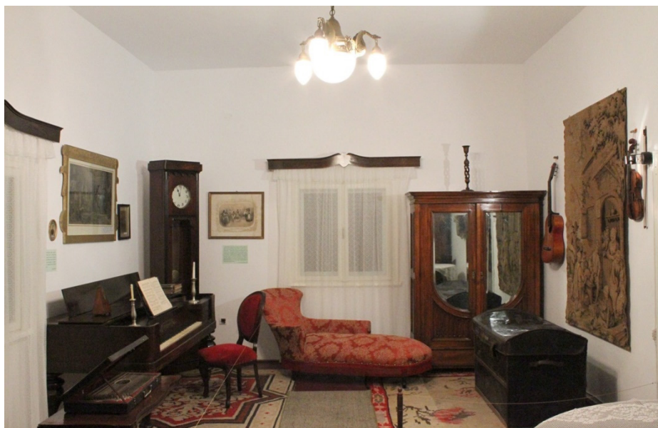
Fig. 20. Interior al Muzeului Memorial „Constantin Negruzzi” din Hermeziu, 2009.