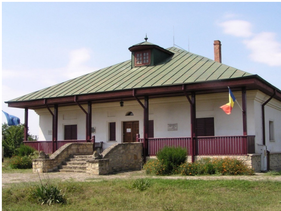
Fig. 19. Muzeul Memorial „Constantin Negruzzi” din Hermeziu, 2009. MNLR Iași