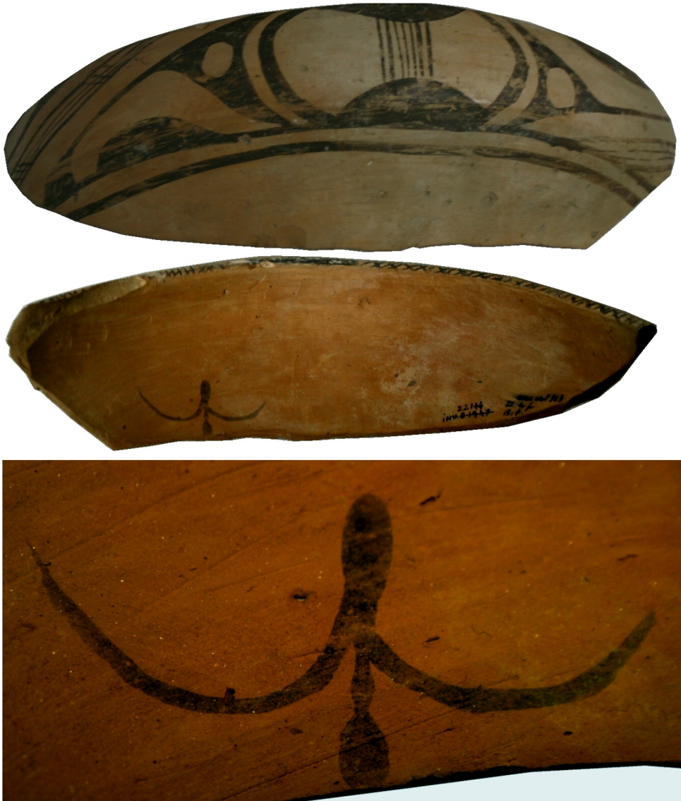
Fig. 3 Cucuteni-Cetățuia – Strachină (fragment de la partea superioară) cu reprezentare antropomorfă (Cucuteni B)