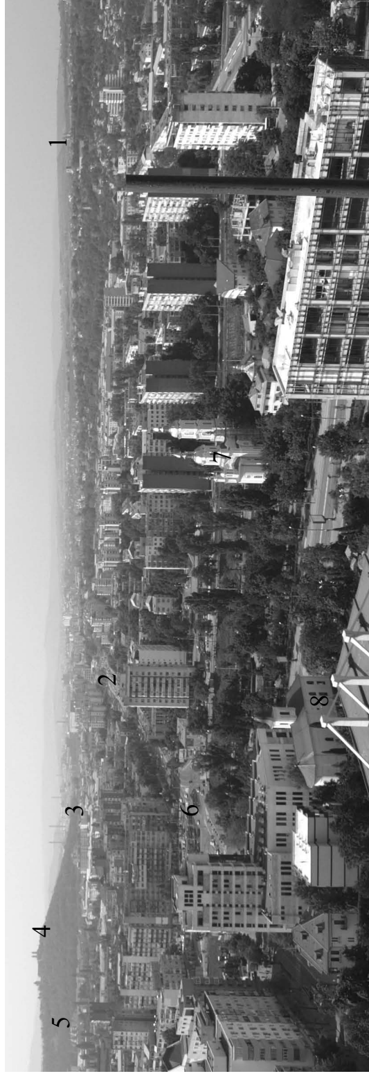
Fig. 1. Vedere panoramică asupra dealurilor Galata și Cetățuia dinspre Palatul Culturii : 1. Mănăstirea Galata; 2. Marele drum al Țărigradului (actuala Șosea Nicolina); 3. Șesul Nicolinei pe care a fost amenajat C.U.G.; 4. Mănăstirea Cetățuia; 5. Mănăstirea Frumoasa; 6. Zona Podul Roș; 7. Biserica Lipovenească de pe malul Bahluiului; 8. Biserica Sf. Constantin și Elena.