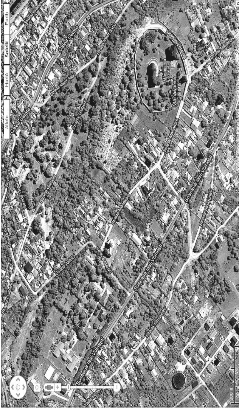
Fig. 8. Imagine din satelit asupra dealului Galata. La vest de mănăstirea Galata este str. Azilului cu casele amenajate de domnița Ruxandra peste fundațiile palatului lui Constantin Ipsilanti ( www.googlemap.com ).