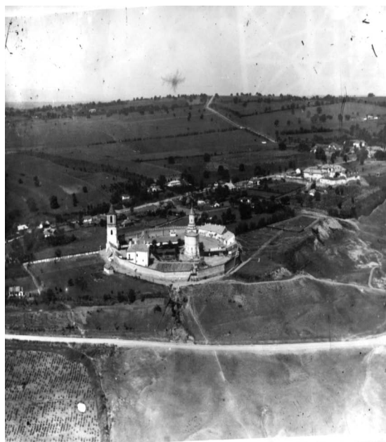
Fig. 3. Fotografii aeriene ale mănăstirii Galata realizate în perioada interbelică. În jurul mănăstirii se observă linii ce pot fi atribuite vechilor șanțuri de apărare amenajate aici. Fotografii prelucrate după originaluri păstrate la SJAN Iași, fond Stampe și Fotografii, d. 5722 (sus) și B.C.U. Iași, Fond N. A. Bogdan, X-12 (jos).