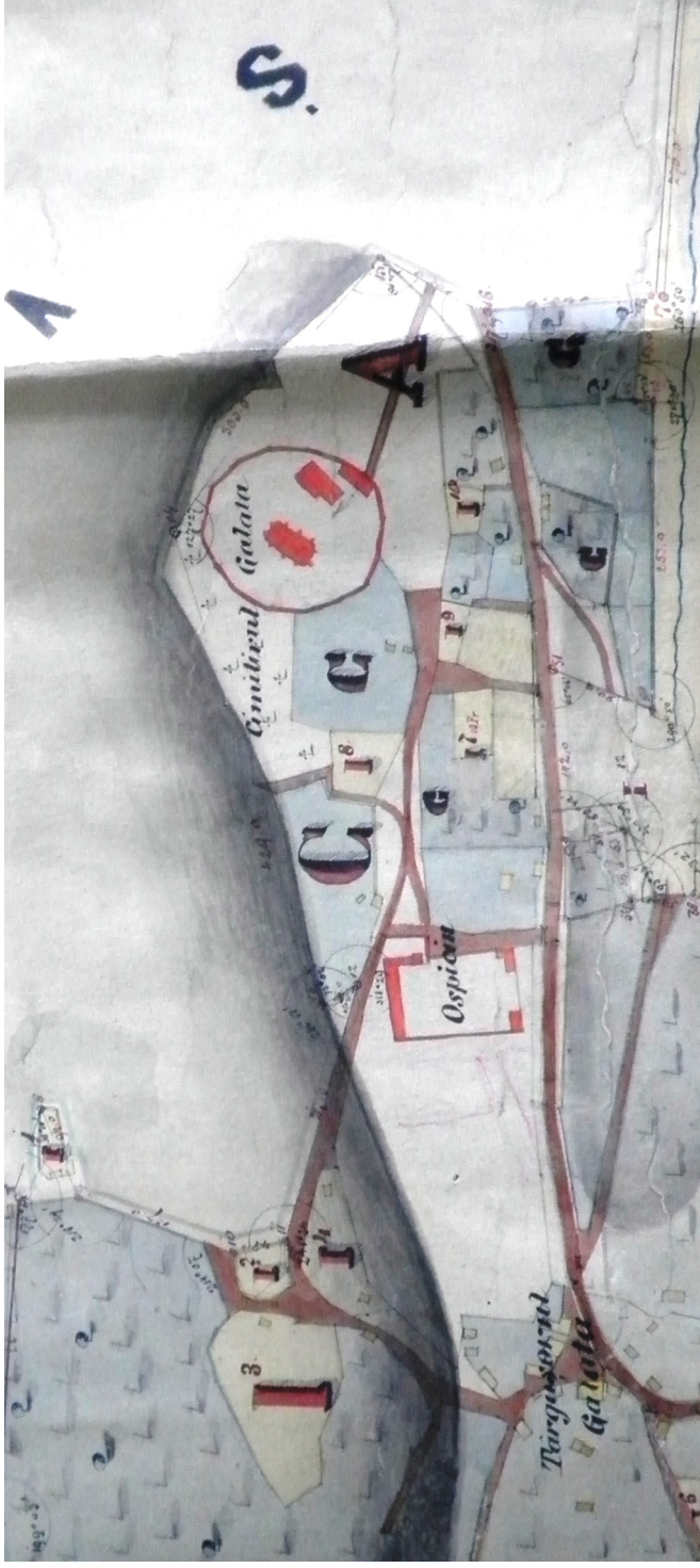
Fig. 7. Detaliu din Planul moșiei Galata realizat în anul 1880: 1. Mănăstirea Galata; 2. Ospiciul amenajat în casele domniței Ruxandra; 3. Târgușorul Galata; 4. Șoseaua Iași-Voinești-Roman.