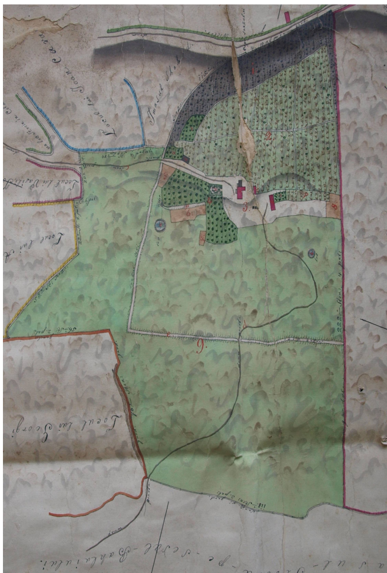
Fig. 4. Planul unei proprietăți de pe dealul Galata realizat în anul 1871. În mijlocul parcelei, notat cu litera “e”, este marcat “sanzu veci” și “capu sanzului”. Prelucrare după SJAN Iași, Fond Planuri și Hărți, d. 540.