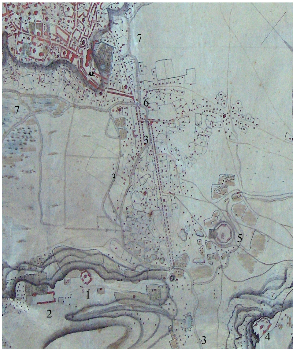
Fig. 6. Fragment din planul orașului Iași realizat de Giuseppe von Bayardi în 1819: 1. Mănăstirea Galata; 2. Palatul lui Constantin Ipsilanti cu grădina amenajată pe latura de nord; 3. Prâul Nicolina cu vechiul său curs spre Podul Roș; 4. Mănăstirea Cetățuia; 5. Mănăstirea Frumoasa; 6. Zona Podul Roș; 7. Vechiul curs al Bahluulului; 8. Curtea Domnească. Prelucrare după SJAN Iași, Fond Planuri și Hărți, d. 447.