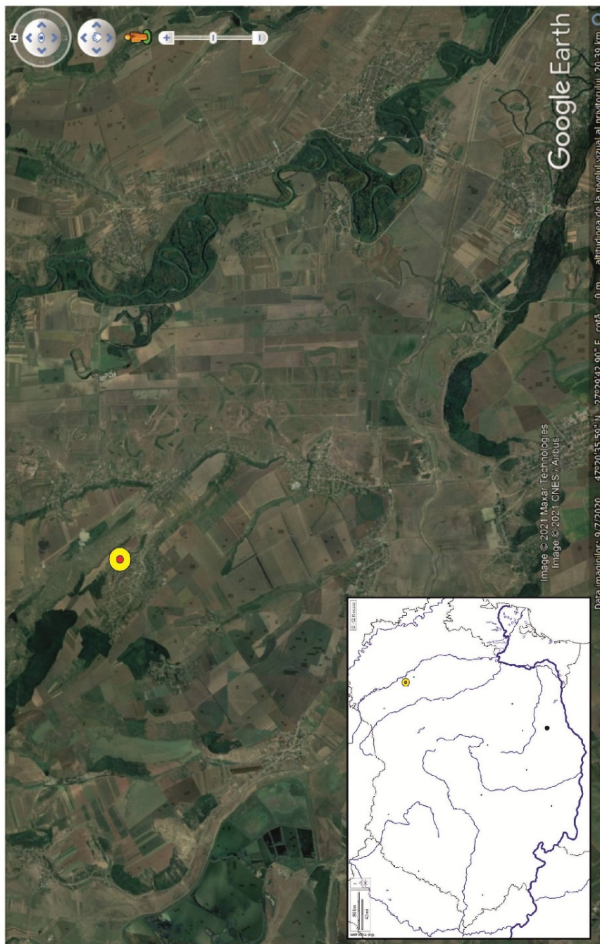
Fig. 1. Harta cu locul descoperirii (map support: Google Earth)