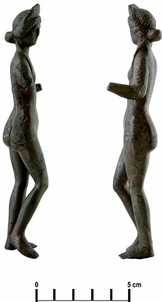
Fig. 3. Venus de Perieni (văzută din profil dreapta și profil stânga)