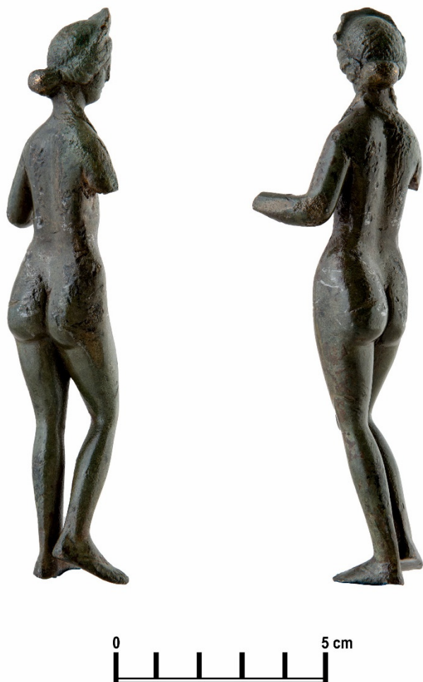
Fig. 4. Venus de Perieni (văzută semiprofil dreapta și semiprofil stânga)