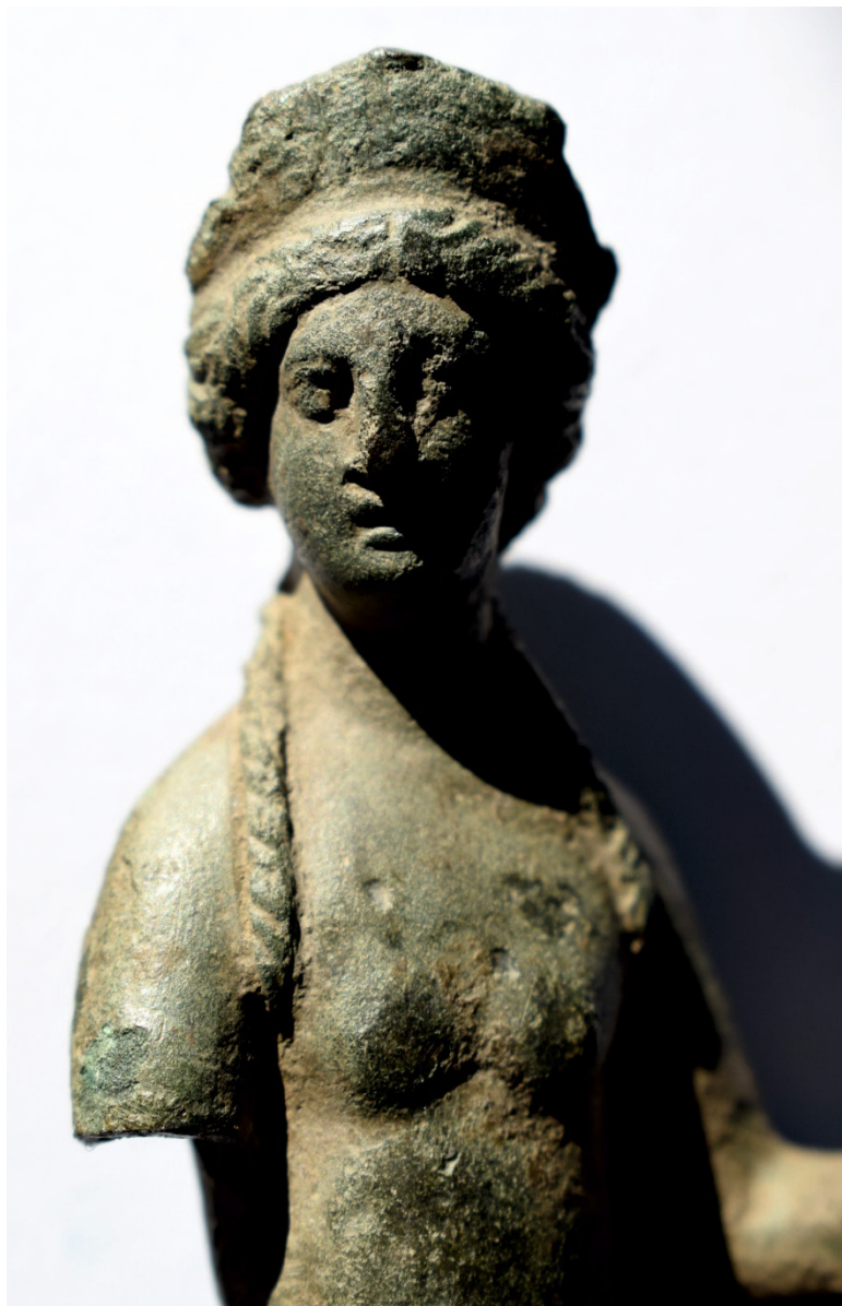
Fig. 5. Venus de Perieni. Fotografie cu o sursă de lumină razantă, cu scopul de a pune în evidență detaliile feței (fără scară)