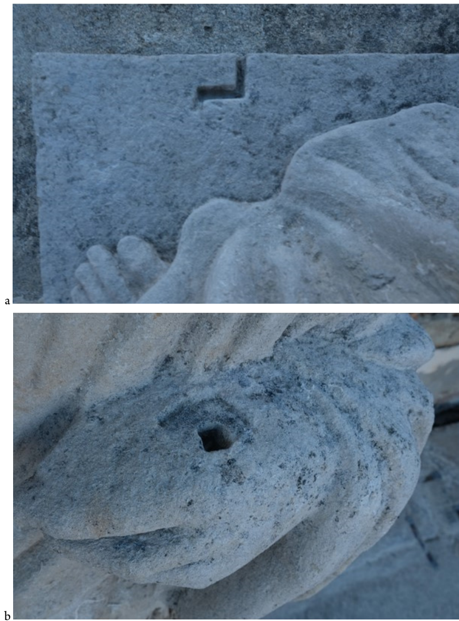
Fig. 3. a, b, Lăcașuri de inserție a unor componente metalice care astăzi nu se mai păstrează