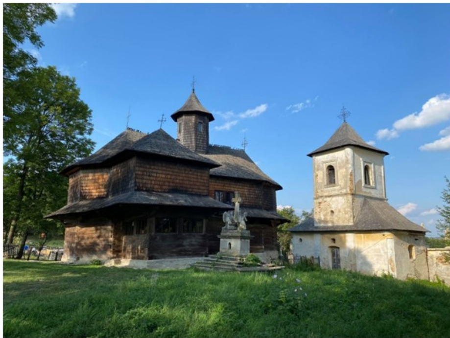
Fig. 1. Ansamblul bisericii de lemn cu hramul „Adormirea Maicii Domnului” de la Hilișeu-Crișan