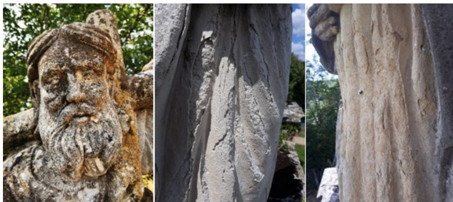
Fig. 2. Detalii ale degradărilor calcarelor la nivelul corpurilor statuare