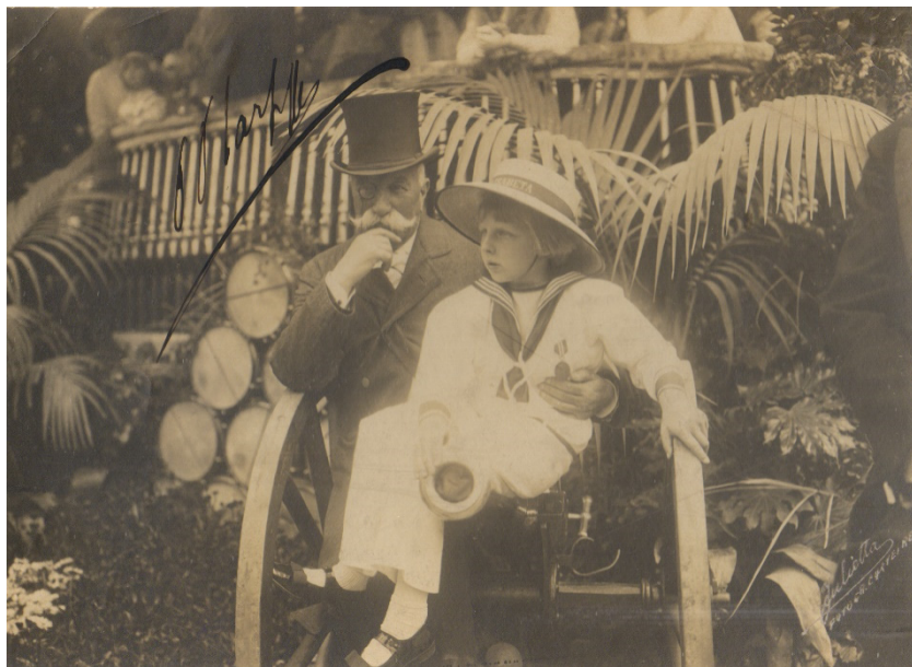
Fig. 4. Petre P. Carp și principele Nicolae al României în curtea casei Carp din București, 1911.