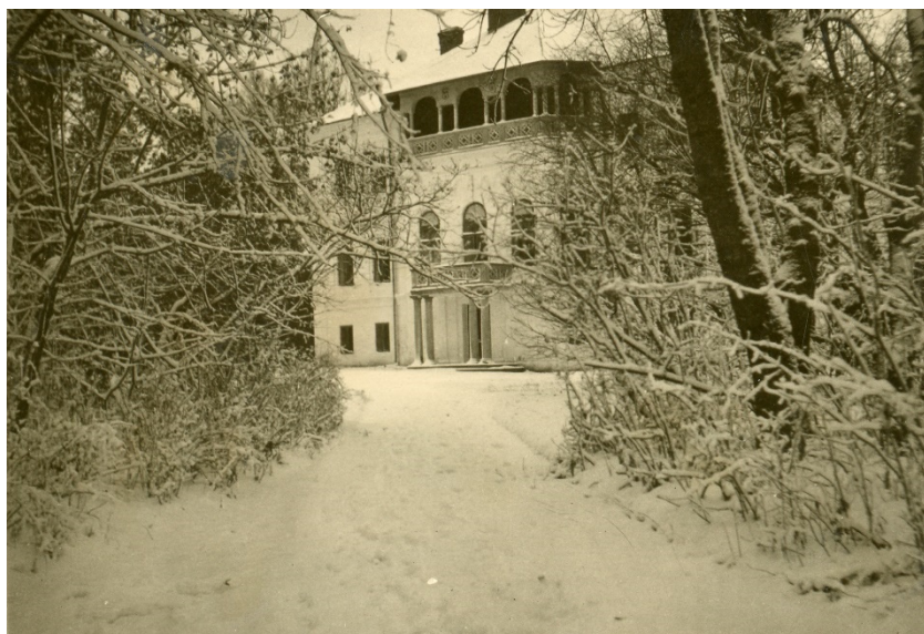
Fig. 10. Conacul Carp din Țibănești. Iarna 1938.