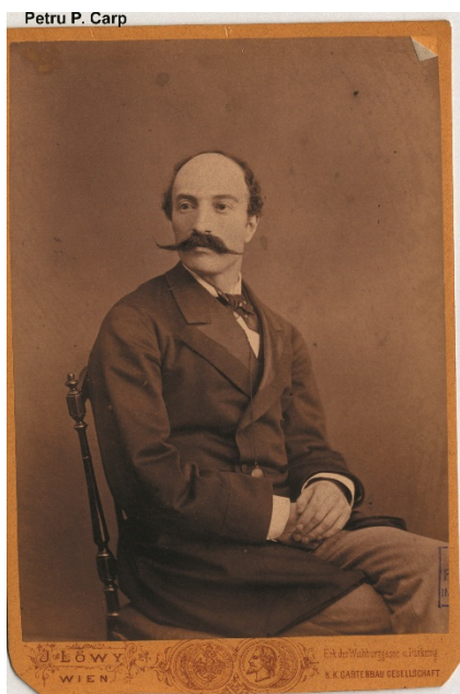
Fig. 3. Petre P. Carp.