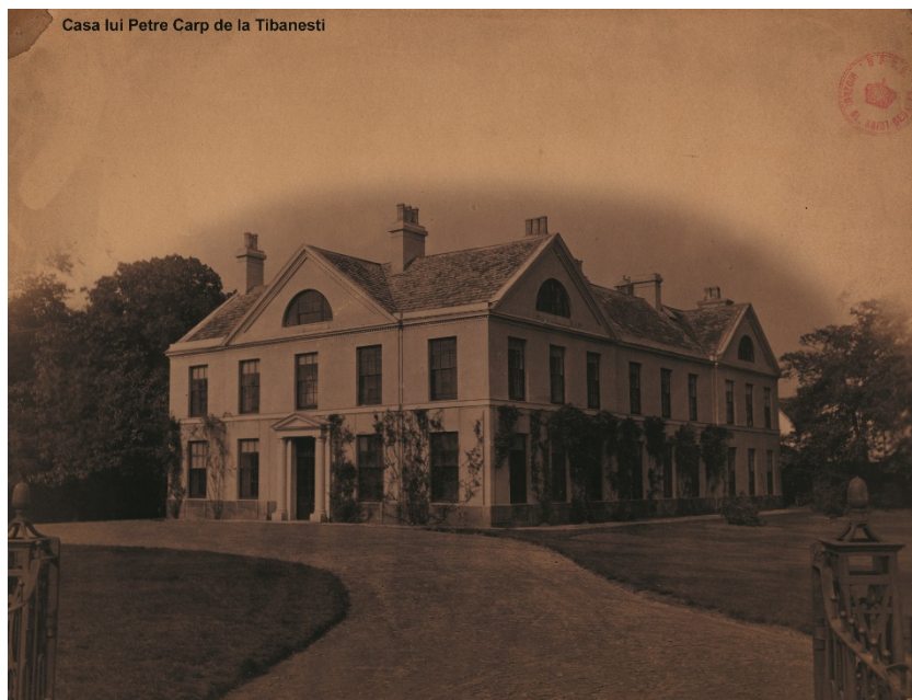
Fig. 9. Conacul de la Țibănești înainte de reamenajarea din vremea lui Petre P. Carp.