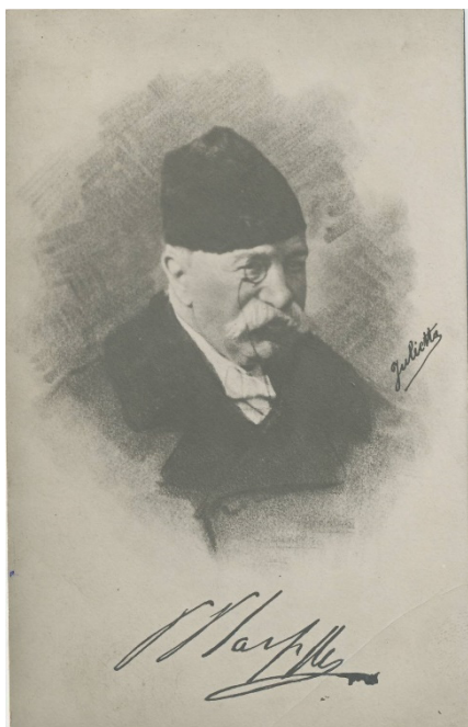
Fig. 5. Petre P. Carp. Muzeul Național de Istorie a României