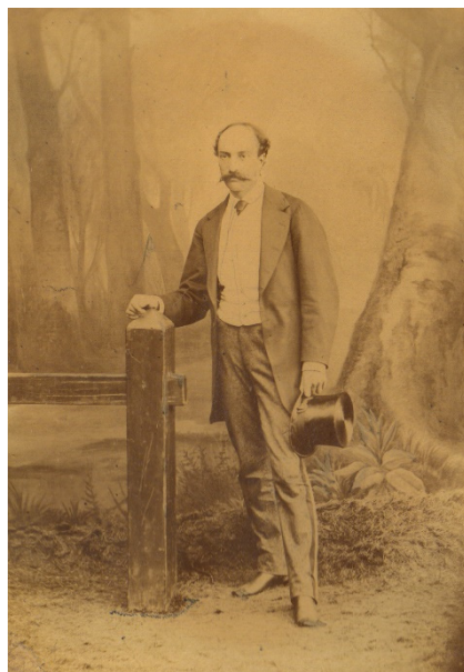
Fig. 2. Petre Carp, tatăl lui Petre P. Carp. 1870. MNLR Iași