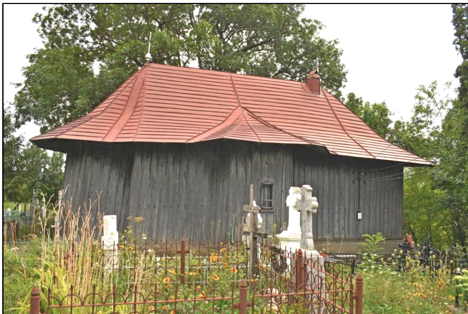
Fig. 5. Biserica Sfântul Nicolae din Ipatele