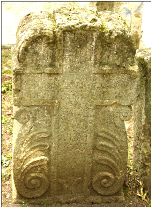
Fig. 17-18. Pietre funerare – Șcheia