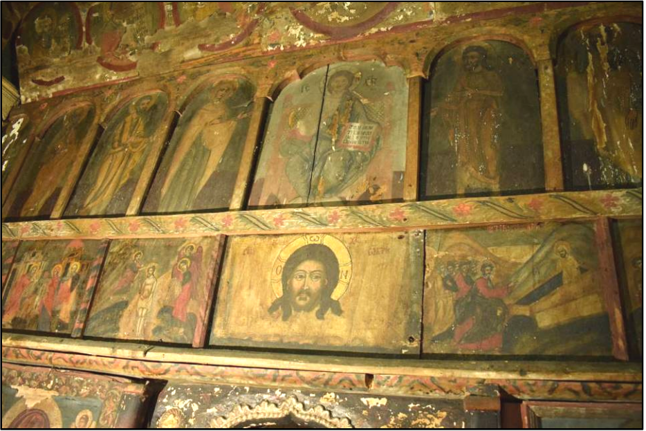
Fig. 10. Detaliu catapeteasmă – Zlodica