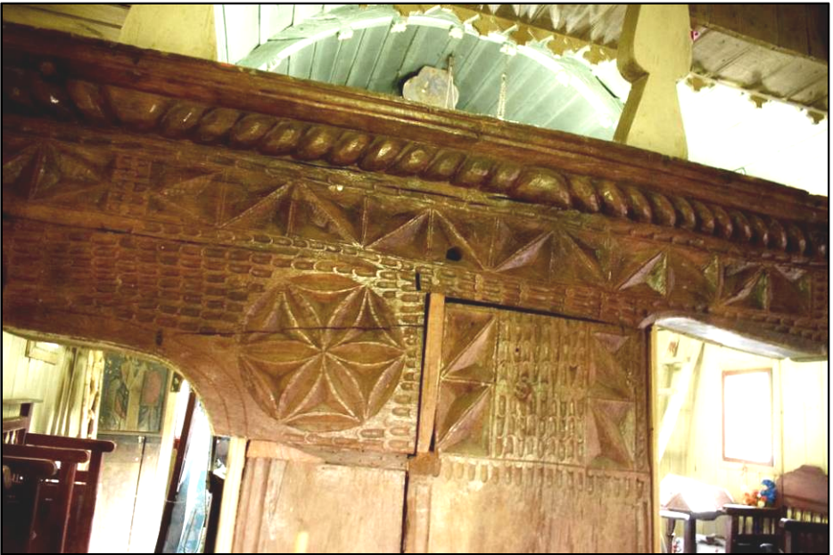
Fig. 7. Primez – Zlodica