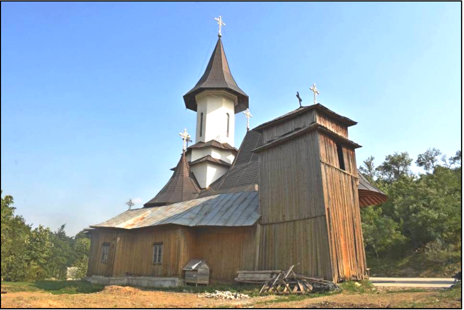
Fig. 2. Biserica Pogorârea Duhului Sfânt din Târgu Frumos