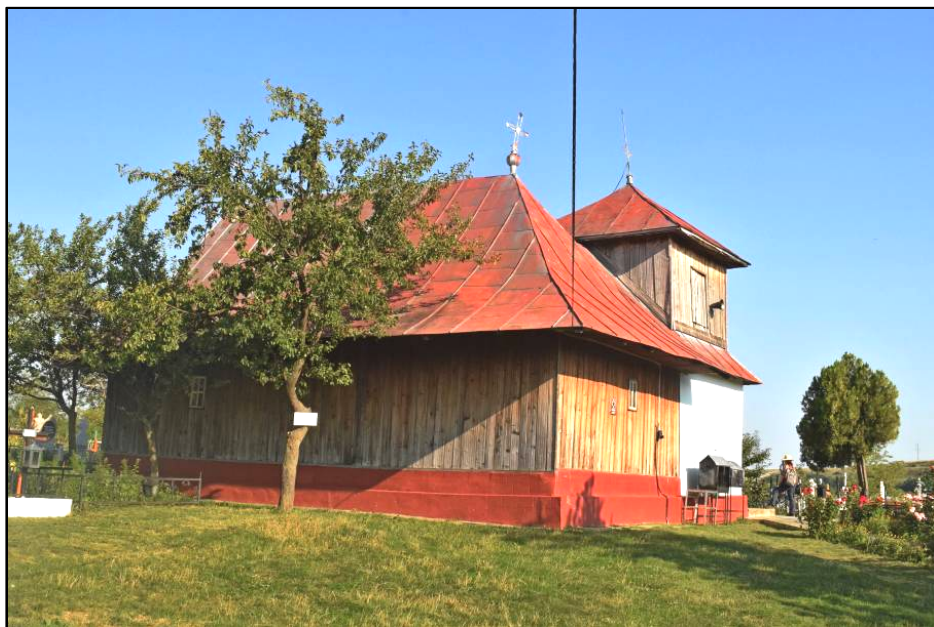
Fig. 1. Biserica Sfinții Voievozi din Costești