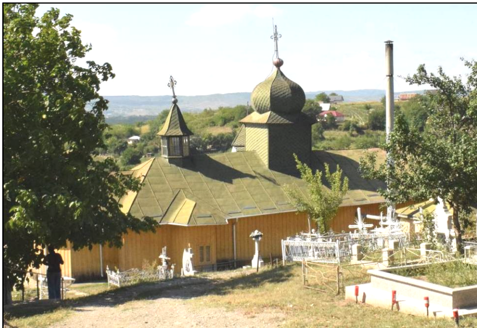
Fig. 4. Biserica Sfântul Nicolae din Ciurbești – comuna Miroslava