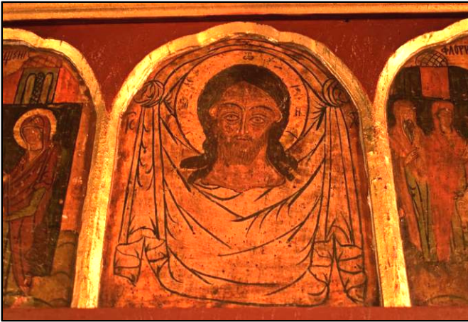
Fig. 13. Icoana Mandylion a lui Hristos – Ipatele