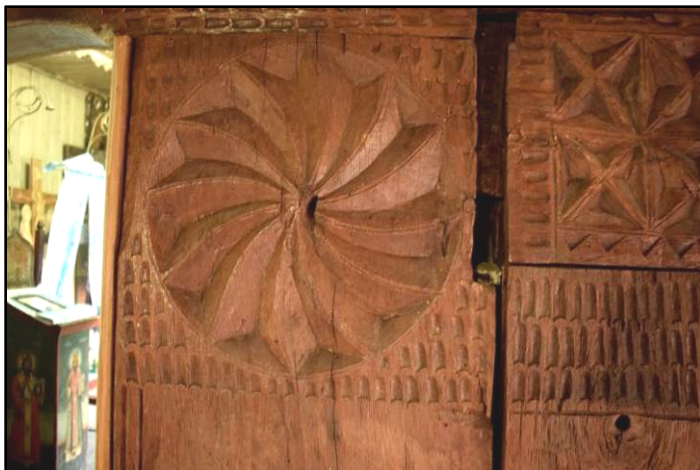
Fig. 8. Detaliu primez – Zlodica