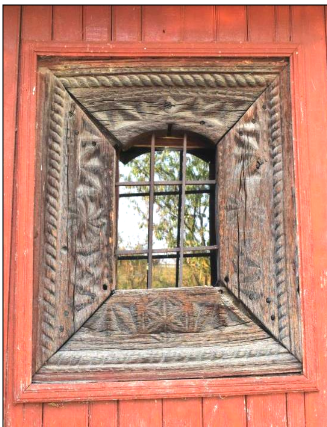
Fig. 9. Ancadrament de fereastră – Zlodica