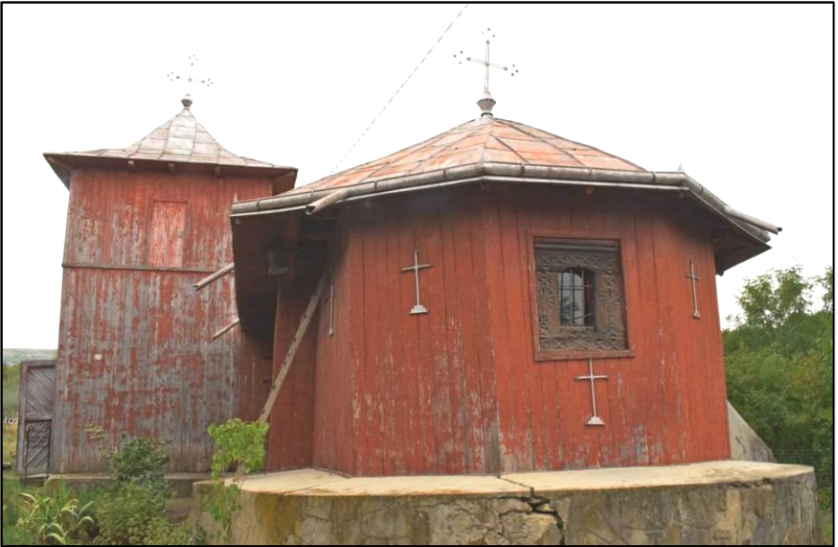
Fig. 6. Biserica Sfinții Voievozi din Zlodica – Ceplența