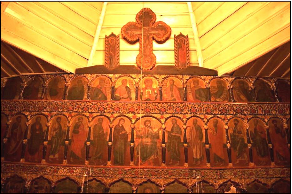
Fig. 11. Catapeteasmă – Șcheia