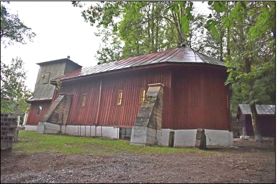
Fig. 3. Biserica Sfântul Gheorghe din Șcheia