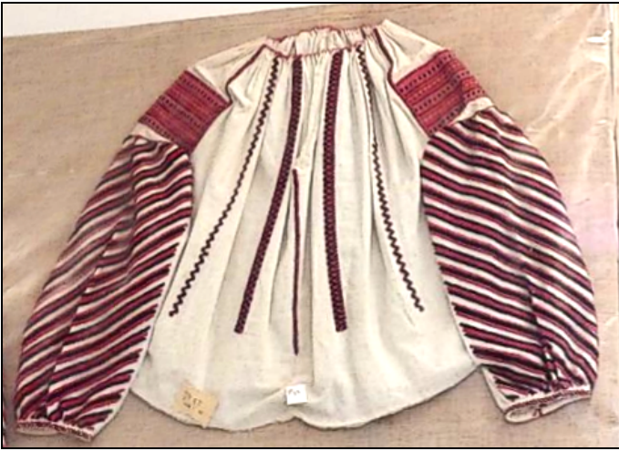
Fig. 12. Cămașă femeiască