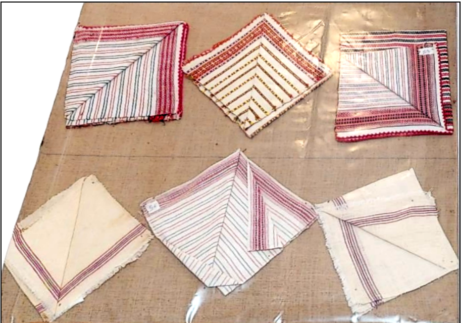
Fig. 19. Batiste de mână (șervete)