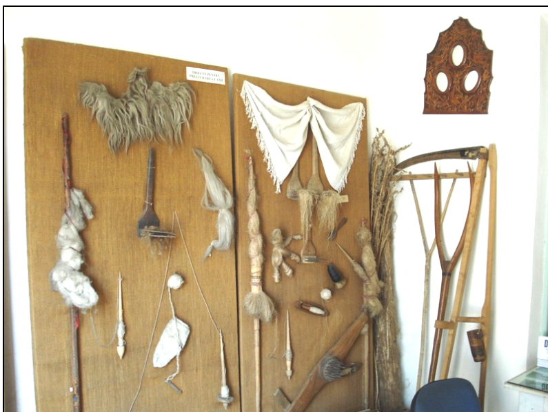
Fig. 26. Obiecte tradiționale pentru prelucrarea lânii și a cânepii (fuior de lână, snop de cânepă, furcă cu fuior de lână, furcă cu fuior de cânepă, fus, piepteni, raghilă, mosoare, suveici, spete, scripeți etc.) alături de o coasă, o furcă și o greblă