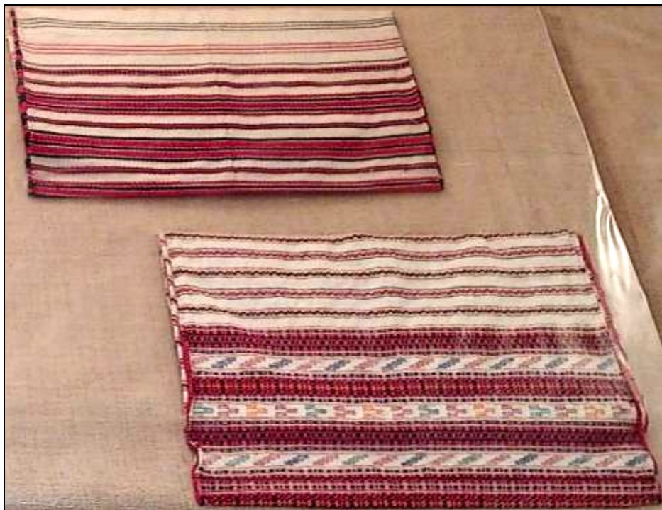
Fig. 15. Țesături de interior (ștergare)