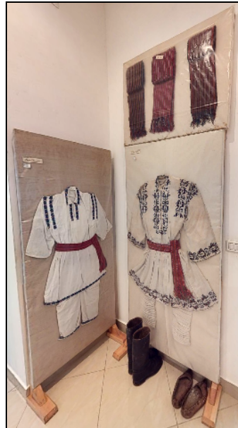
Fig. 8. Obiecte de port popular bărbătesc (cămăși, braie, bârnețe, ițari, opinci, cizme)