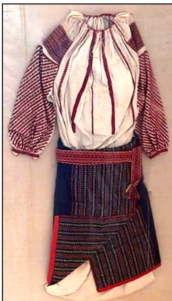
Fig. 11. Costum popular femeiesc (cămașă, catrință, bârneț)