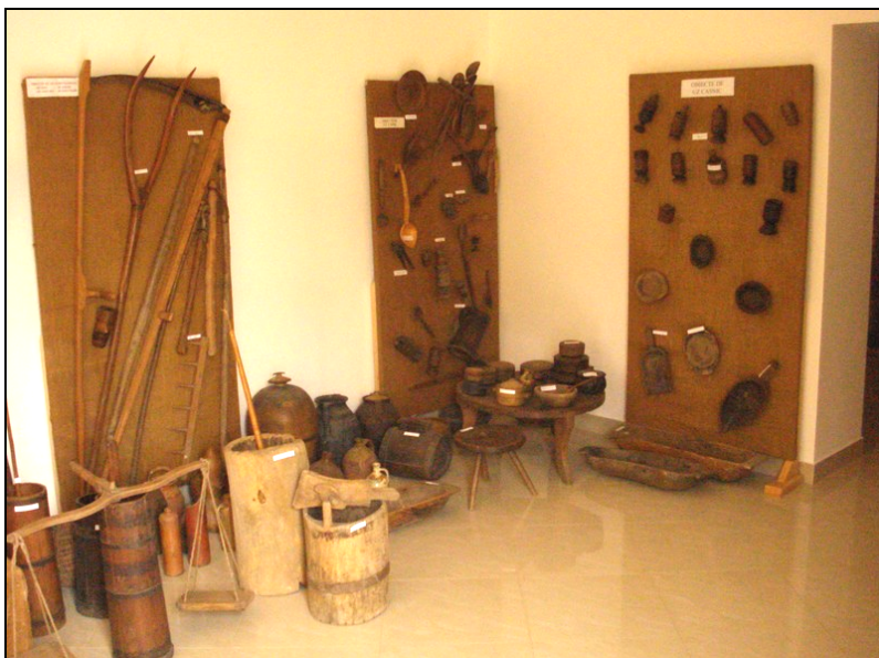
Fig. 25. Obiecte de uz gospodăresc și casnic (furcă, coasă, îmblăciu, greblă, linguri, linguroaie, solnițe, pipernițe, căușe, cobiliță, ulcioare, clești, câni, covățele, scaunul cu trei picioare, măsuță, putineie, balercă, cântar etc.)