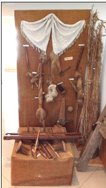
Fig. 21. Obiecte tradiționale pentru prelucrarea cânepii (snop de cânepă, fușalăi, raghilă, furcă cu fuior, piepteni, mosoare, păpuși din cânepă, suveici, perie pentru fuior, fus cu cânepă, spată, vatale etc.)