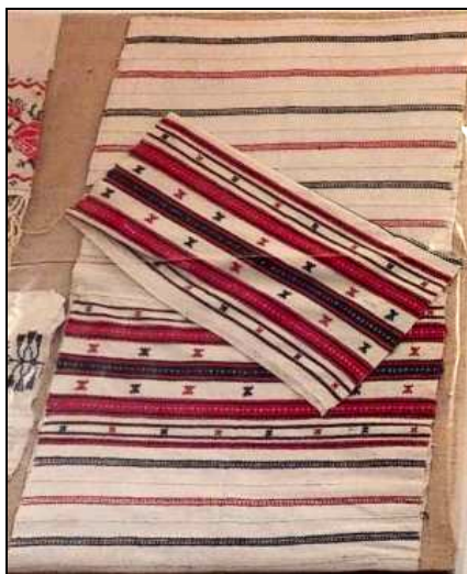
Fig. 17. Țesături de interior (ștergare)