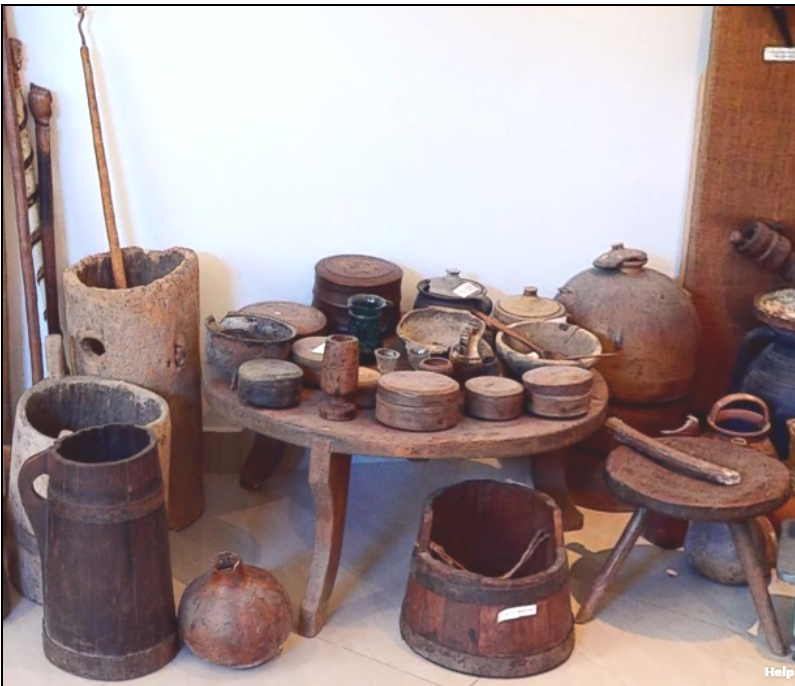
Fig. 24. Obiecte de uz casnic așezate pe o măsuță, alături de un putinei, o găleată pentru muls lapte, un scănel cu trei picioare etc.