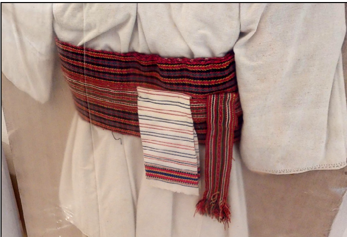
Fig. 14. Detaliu de costum popular bărbătesc (cămașă, brâu, bârneț, șervet)