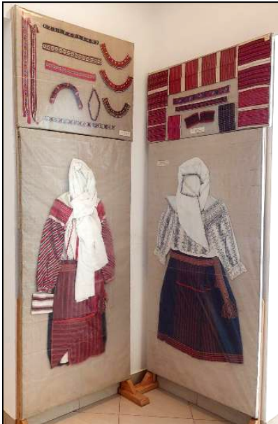
Fig. 7. Obiecte de port popular femeiesc (cămăși, ștergare de cap, catrințe, bârnețe, altițe, manșete, obiecte de podoabă)