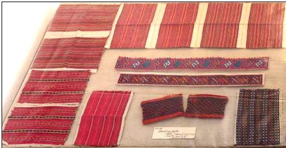
Fig. 20. Obiecte de port popular (altițe, manșete, gâțari)