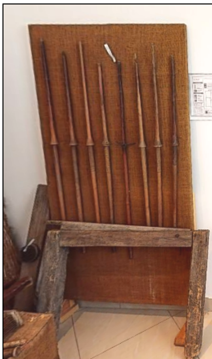
Fig. 22. Furci de tors