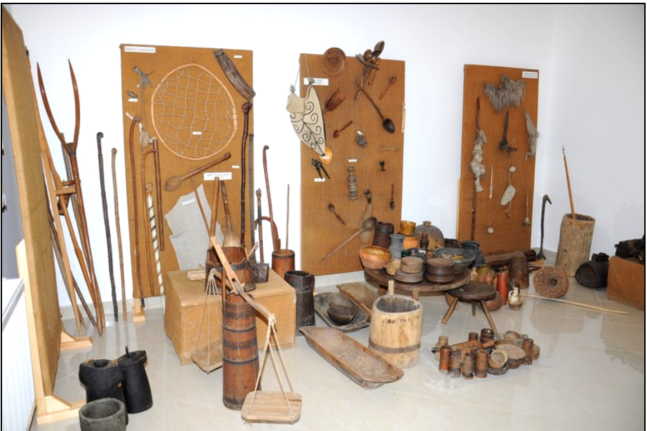
Fig. 28. Obiecte folosite la stână (bâte, hârzob, glugă, linguroi etc.), alături de obiecte pentru prelucrarea cânepii, obiecte de uz gospodăresc și obiecte de uz casnic