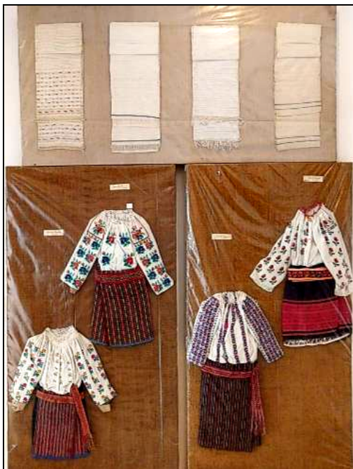
Fig. 9. Costume populare de fetițe (cămăși, catrințe, fotă, bârnețe; în partea superioară sunt expuse ștergare de cap)