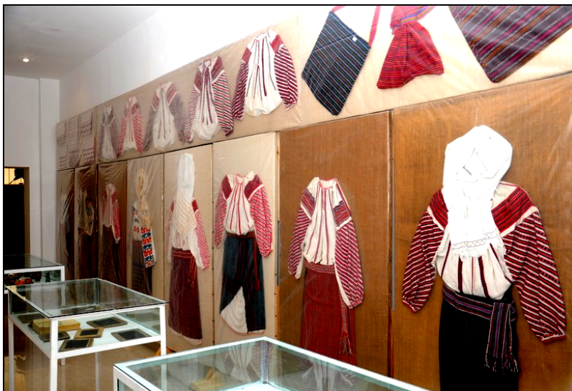
Fig. 3. Obiecte de port popular femeiesc (cămași, ștergare de cap, catrințe, bârnețe, traiste). În vitrinele orizontale sunt expuse, în vase tradiționale, ouă de Paști (vopsite, respectiv încondeiate), precum și diferite obiecte specifice vieții de școlar