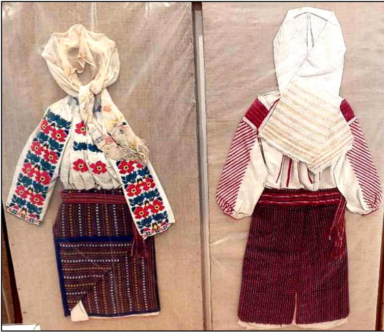
Fig. 6. Costume populare femeiești (cămăși, ștergare de cap, catrințe, bârnețe)