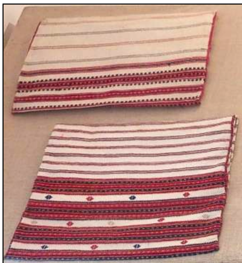
Fig. 16. Țesături de interior (ștergare)