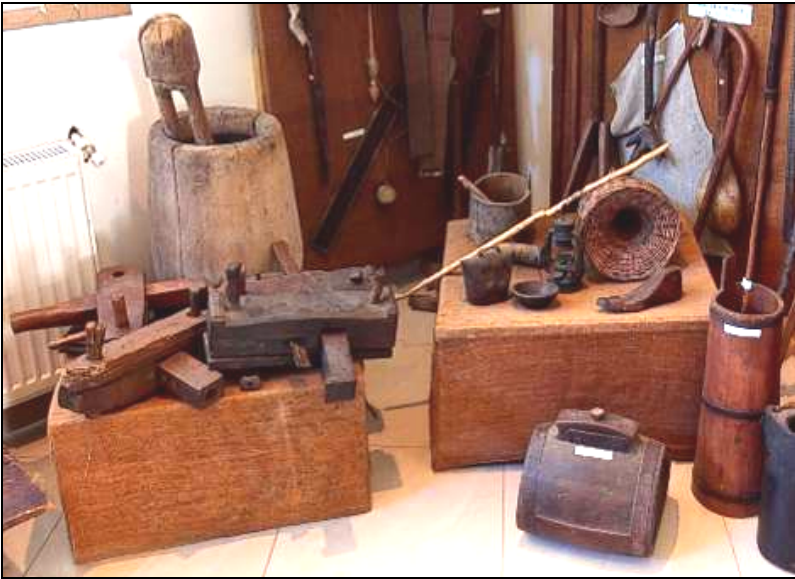
Fig. 23. Obiecte specifice îndeletnicirilor tradiționale (putinei, balercă, piuă cu chilug, lampă, clopoțel, coș pescăresc etc.)