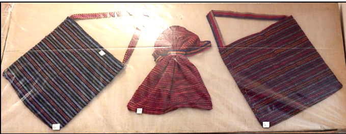
Fig. 13. Traiste tradiționale