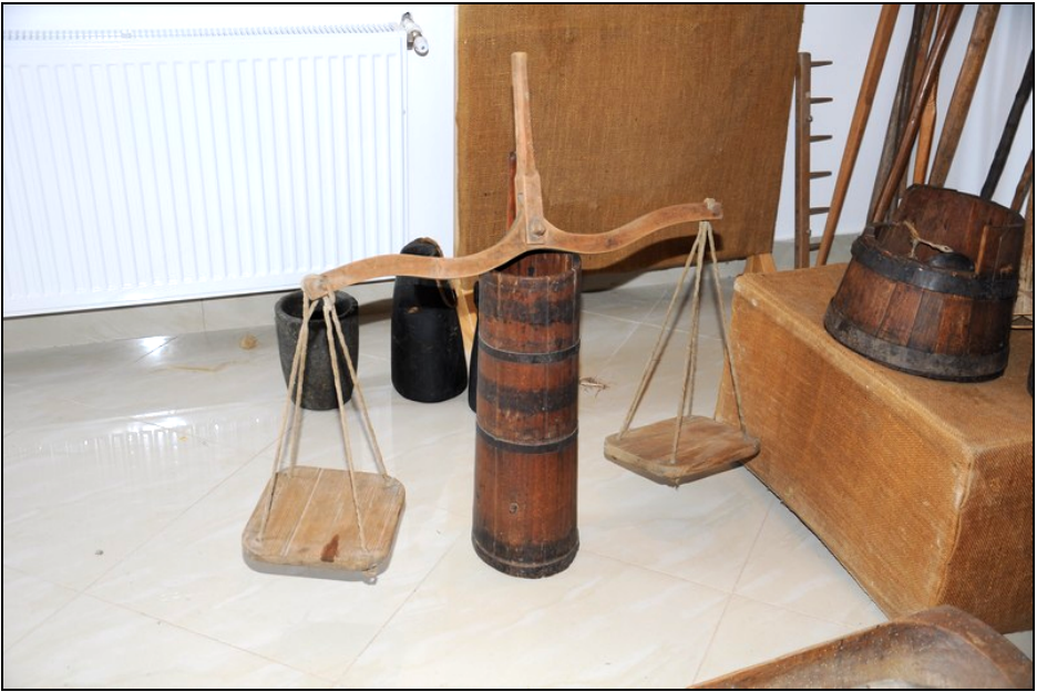
Fig. 27. Cântar așezat pe un putinci