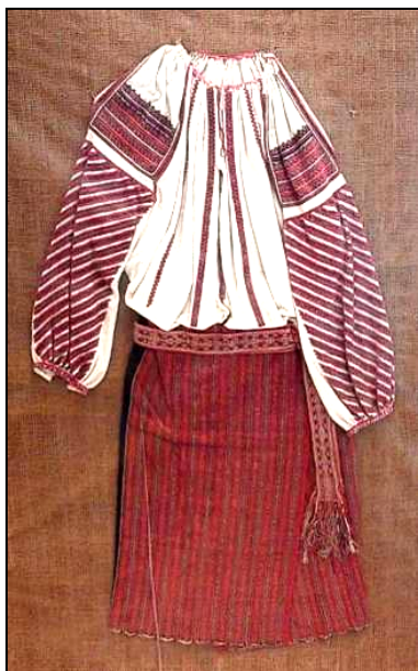
Fig. 10. Costum popular femeiesc (cămașă, catrință, bârneț)