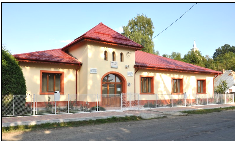
Fig. 2. Clădirea Complexului Muzeal „Paul Țărălungă” din Prăjești