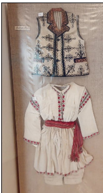
Fig. 4. Costum popular de băiat (cămașă, bârneț, ițari, bundiță)