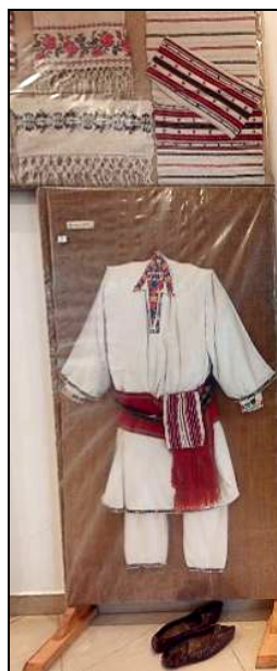
Fig. 5. Costum popular bărbătesc (cămașă, brâu, bârneț, batistă de mână, ițari, opinci) și țesături de interior (ștergare de perete)