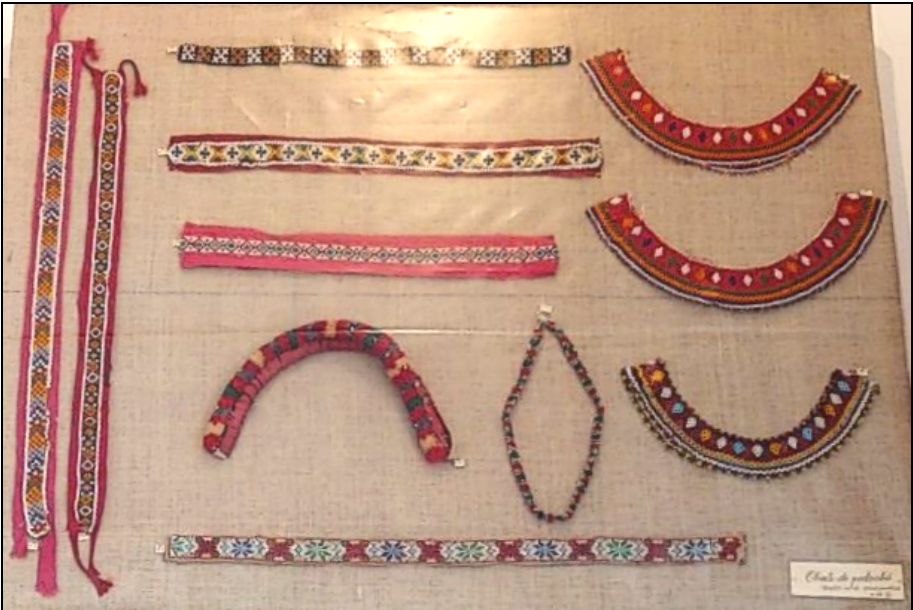
Fig. 18. Obiecte de podoabă (bentițe, zgărdițe, gherdane, gățari)