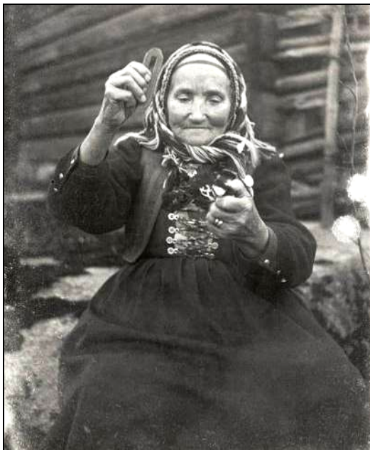
Fig. 8. Localnică din Dalarna (Suedia) utilizând amnarul și cremenea (1916) 15

Amnarul, cremenea și iasca sunt o prezență constantă în societățile umane de pe întreg mapamondul, situație ce poate fi constatată și în veacurile XIX-XX, așa cum arată o fotografie din 1916 înfățișând o săteancă din districtul Dalarna (centrul Suediei) (Fig. 8). Plecând de la această observație, se impune o încercare de analiză a utilizării acestor elemente cu predilecție asupra spațiului românesc.