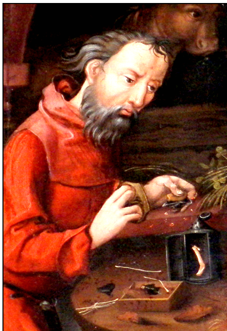
Fig. 4. „Sfânta Familie” (detaliu). Retablul altarului bisericii Saint-Georges din Haguenau (Franța) 7

Hans, în 1496. În partea stângă a lucrării, în planul al doilea, este reprezentat procesul de aprindere cu ajutorul amnarului a unei lumânări