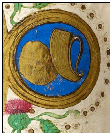
Fig. 7. Amnar și creme. Miniatură din Sf. Ion Climacus (Scărarul), Florența, 1488 13