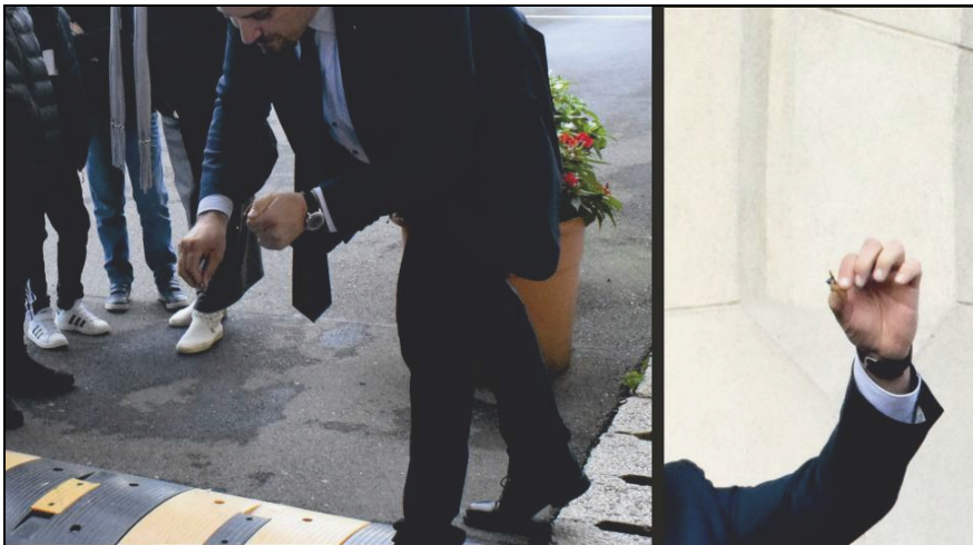
Fig. 2. Aprinderea focului. Demonstrație făcută la Muzeul de Istorie a Moldovei, „Noaptea Cercetătorilor Europeni”, 2022