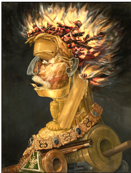
Fig. 5. Giuseppe Arcimboldo, „Focul”. Kunsthistorische Museum, Viena 8

din minele morave și obținut în topitoriile imperiale –, iar nasul și urechea sunt substituite de două amnare din oțel. În jurul gâtului este reprezentat „Ordinul Lânii de Aur”, cu al său colan compus din elemente articulate în formă de amnare. Spațiile dintre ele sunt completate cu pietre ovale, în nuanțe de gri spre negru, ce semnifică cremenea, toate fixate în monturi de aur. Amnarele care formează nasul și urechea, precum și cele din construcția colanului sunt simboluri ale dinastiei de Habsburg. De aici pleacă și ideea că piatra și metalul sunt apanajul mediului militar. Privită cu atenție, lucrarea lui Arcimboldo este o referință clară la Casa de Habsburg și la beneficiarul alegoriei: împăratul Maximilian al II-lea 9 (Fig. 5).