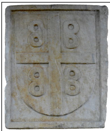
Fig. 6. Placă de marmură aparținând familiei imperiale a Paleologilor 12

Reprezentarea amnarului în heraldică apare încă din perioada împăraților din dinastia Paleologilor, care domnesc în Imperiul Bizantin începând cu 1259. Pe steagul imperial, decorat cu o cruce galbenă pe un fond de culoare roșie, apar patru amnare în forma literei „B” reprezentând deviza imperială „βασιλεὺς βασιλέων, βασιλεύων βασιλευόντων” 11 („Basileus Basileon, Basileuon Basileuonton”), care se traduce în felul următor: „Împăratul împăraților, care guvernează peste cei care conduc” (Fig. 6). După căderea Constantinopolului, amnarul, ca simbol heraldic, se răspândește în spațiile mediteranean și balcanic (Fig. 7). Îl regăsim stilizat pe denarii lui Domenico Gattilusio, stăpânitor al Insulei Lesbos (1455-1458); în armoriile lui William al IX-lea, marchiz de Montferrat (1486-1518); pe monedele regilor Spaniei, Filip al II-lea (1556-1598) și Filip al III-lea (1556-1598), ca regi ai Neapolelui; în armoriile Casei de Gonzaga, ca duci de Mantua (după 1575); pe blazonul Serbiei (cca 1600-1620) etc.