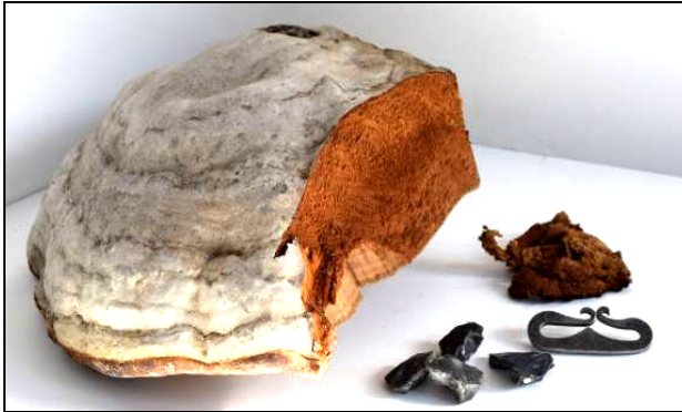
Fig. 1. Iască, fibre de iască, amnar și cremene

Conceptul muzeografic a fost însoțit de un catalog, în paginile căruia informațiile prezentate în expoziție prin intermediul panourilor complementare au fost reunite, printre care și cele dedicate subiectului de față 2 . Cercetarea acestei teme a fost continuată prin realizarea unor prezentări, constând din culegerea, tăierea și tratarea ciupercii numite iască, urmată de aprinderea fibrelor vegetale cu ajutorul unui amnar-replică și cremenii (silex), acțiune finalizată cu mare succes (Fig. 1-2).