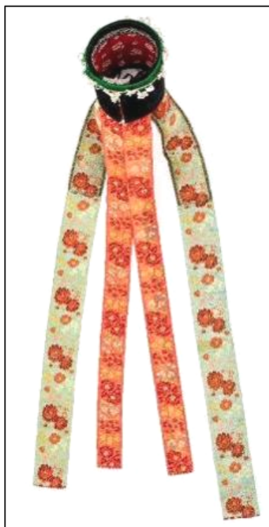
Fig. 9. Borten (nr. inv. 2677 P). Vedere spate

Remarcăm modul de împodobire a Bortenului cu numărul de inventar 2567 P (Fig. 9), la care pe buza superioară este aplicată o stinghie de lemn modelată pe forma cilindrului. Cercul de lemn este atent învelit în fir textil mătășos gros, verde smarald, obținându-se aspectul de panglică profilată. La baza elementului decorativ sunt ancorate, cu fir textil verde, buchețele albe care sugerează flori de colț și lămâițe. Nu putem să nu descriem modul ingenios de obținere a acestor buchețele. Baza buchețelului este formată din sârmulițe subțiri albe, adunate în mănunchi învelit complet cu fir alb mătășos. De capetele libere (care ies din mănunchi) sunt prinse