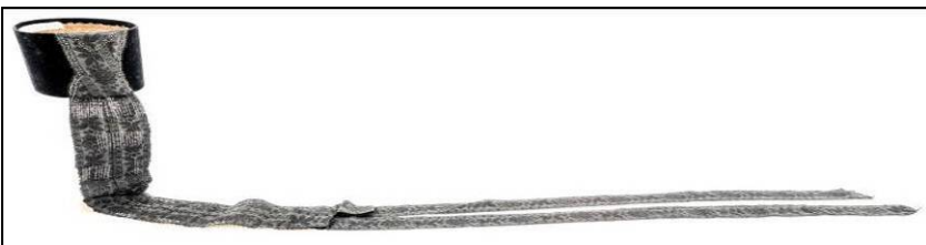
Fig. 13. Borten (nr. inv. 2227 P). Decorație spate

Bortenul cu numărul de inventar 2227 P (Fig. 13) păstrează încă panglica neagră atașată la spate. Panglica lungă este pliată la mijloc, formând un triunghi. Baza triunghiului este prinsă de marginea superioară, cu vârful îndreptat spre pământ.