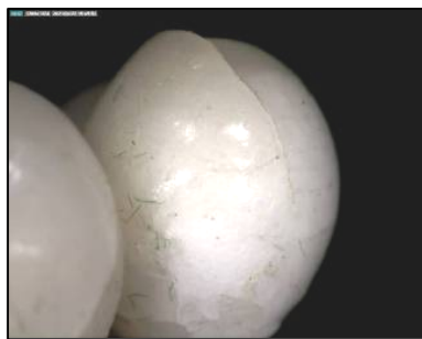
Fig. 10. Elemente globulare din cretă și ceară (microfotografie dinolite)

fie bobite sferice, fie ovoidale, albe. Centrul este marcat de paiete cu mărgele și floricele din hârtie cerată.