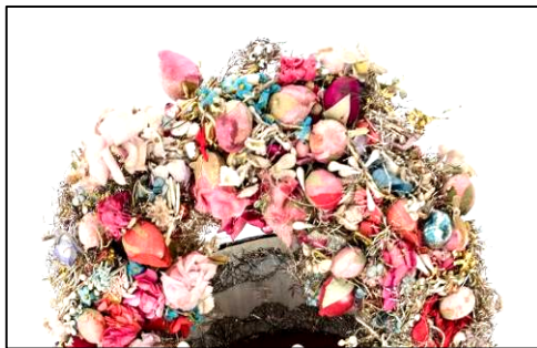
Fig. 17. Borten (nr. inv. 7006 P). Detaliu coroană

Pe lângă efectul coloristic deosebit, nu sunt de neglijat nici metoda de construcție a elementelor decorative și nici modul lor de asamblare în acest tot unitar complex. În realizarea florilor observăm o varietate de materiale: hârtie simplă, cerată, argintată, bumbac simplu sau cerat, mătase fină, plastic, ceară, dar și detalii sclipitoare date de mărgelile de sticlă, plastic și fire metalice. Prin urmare, coroana include boboci rezultați din vată de bumbac sau papier mache înveliți în mătase fie ea naturală sau vegetală; maci, nu-mă-uita, lăcrămioare, campanule decupate din bumbac sau hârtie colorată, în forme recunoscutibile, presate la cald și apretate pentru a oferi detalii identitare; panseluțe, boboci, din catifea colorată, gerbere din lamé sau hârtie colorată, trandafiri din mătăsuri și hârtie, flori de colț din ceară, frunze delicate obținute dintr-o varietate de materiale naturale sau sintetice (Fig. 17). Elementele globulare sunt din sticlă sau plastic aurit, argintat sau roșu, iar mazăricea albă, ca și în cazul Bortenului de Bistrița, este confecționată din ipsos și ceară. Toate aceste componente sunt atent prinse pe tije de sârmă fină, învelite în fire textile sau hârtie colorată. Spațiile goale dintre elemente sunt umplute cu beteală aurie și fir metalic. Armătura coroanei este realizată din joarde de lemn arcuite, strânse împreună și învelite în fir roșu. Capetele joardelor sunt tensionate în partea inferioară cu panglică roșie.