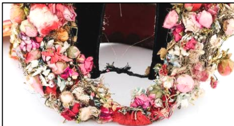
Fig. 21. Borten (nr. inv. 7006 P). Detaliu – zona inferioară

Concluzionăm prin această analiză că deși extrem de simple la prima vedere, Bortenele implică tehnici precise de asamblare și o cunoaștere a proprietăților fizice ale materialelor, respectate de pălărierii de la oraș din întreaga Transilvanie. Atenția pentru detalii se observă în mascarea elegantă a imperfecțiunilor de tehnică (ancorări, îmbinări și cusături grosiere etc.), prin aplicarea de elemente decorative. Chiar și cusăturile grosiere și sârmele inestetice de la spate sunt acoperite/învelite în materiale prețioase, panglici și șireturi (Fig. 21). De asemenea, se remarcă repetarea acelorași tehnici de coasere (indiferent de regiunea în care a fost confecționat), adaptate în funcție de zona de intervenție în confecționare și servind estetic obiectului.