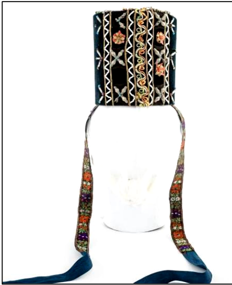
Fig. 11. Borten (nr. inv. 2577 P). Vedere spate

Bortenul cu numărul de inventar 2577 P (Fig. 11) prezintă pe buza superioară dantelă din șnururi textile colorate și fir metalic, șirag de