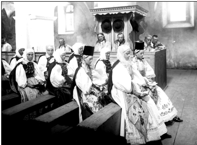
Fig. 1. Slujbă religioasă, Biserica Evanghelică Nou Săsesc, județul Sibiu, începutul secolului al XX-lea.