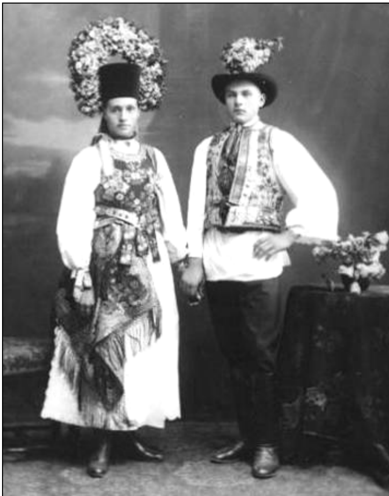
Fig. 15. Miri sași, Slimnic, județul Sibiu.

Bortenul de mireasă cu numărul de inventar 7006 P face parte din a doua categorie de cununi de mireasă. Toca de catifea neagră are o înălțime de cincisprezece centimetri și un diametru de optsprezece centimetri. La spate, Bortenul prezintă o deschidere reglabilă de cca opt centimetri. Capetele sunt fixate cu sârmă în partea inferioară și în cea superioară. Interiorul este căptușit cu două tipuri de material textil: mătăsos, gri albastru, în partea superioară, și bumbac roșu, în partea inferioară. De baza interioară (zona frunții) este lipită o bandă de vinilin, decupată pe marginea superioară cu arcade zimțate. Nici aici nu lipsesc cele două șiruri de dantelă tip ciocănele din fire metalice.