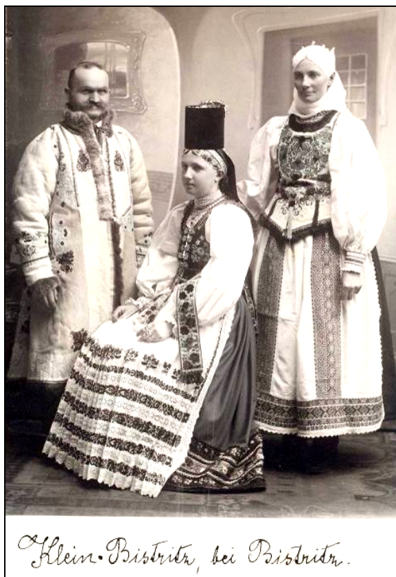
Klein-Bistrița, bei Bistrița.

În folclorul săseesc, sunt cunoscute povești care încearcă să explice apariția și încărcătura spiritual-emoțională a acestui element deosebit. Una dintre acestea ne povestește despre curaj, vitejie și empatie socială. Istorisirea ne parvine din localitatea săsească Dorolea, județul Bistrița-Năsăud, cunoscută în trecut sub numele de Bistrița Mică (Fig. 3) și relatează încercarea unor localnici de a se alia cu turcii pentru asediarea orașului Bistrița. Aflând despre acest plan, fiica clopotarului a ieșit, într-o zi de luni, pe ulițele orașului bătând în toabă, anunțând pericolul și salvând, astfel, localitatea de la invazie. În amintirea acestei fapte de curaj a fetei, în prima zi de luni din ianuarie se sărbătorește Lunea juraților (ger. der geschworene Montag ). În seara ce preceda această sărbătoare, toate fetele din zona Bistriței se strâneau la dans purtând pe cap un element circular înalt, negru, care sugera toba. Astfel avem o posibilă explicație pentru elementul vestimentar Borten .