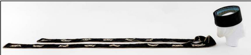
Fig. 12. Borten și panglică (nr. inv. 7488 P)

Bortenele cu numerele de inventar 7488 P și 2227 P sunt două exemple elocvente de versatilitate a acestor elemente vestimentare. Bortenul cu numărul de inventar 7488P (Fig. 12) este din catifea neagră, căptușit la interior cu material albastru și decorat cu trei rânduri de dantelă metalică de diferite lățimi (jumătăți de fluture). Panglica asociată lui este lungă de trei metri și lată de șapte centimetri. Aceasta este confecționată din catifea neagră, garnisită pe margini cu pasmanterie metalică îngustă, cusută manual. De-a lungul ei sunt aplicate, la distanțe egale, prin coasere înaintea acului, elemente textile florale bej-argintiu cu accente movulii. Vizual, acestea creează impresia de broderie în relief, când, de fapt, sunt elemente decupate și adăugate pentru accent de culoare.