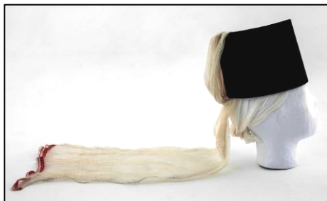
Fig. 6. Borten (nr. inv. 11148 P). Vedere laterală

Bortenul din localitatea Miercurea Sibiului 14 , identificat cu numărul de inventar 11148 P (Fig. 6), are o înălțime de cincisprezece centimetri și un diametru pe circumferința capului de șaptesprezece centimetri. La spate,