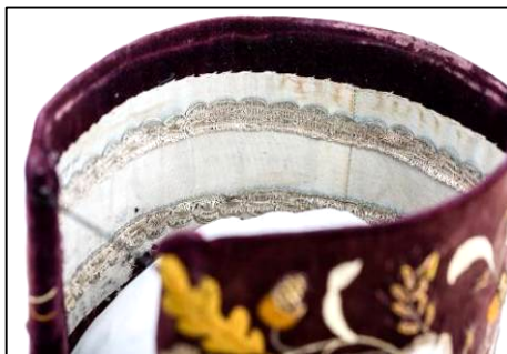
Fig. 18. Borten (nr. inv. 2252 P). Detaliu – catifea și căptușeală

longitudinale ale cartonului (Fig. 18). Remarcăm câteva metode de ancorare și tensionare a acesteia pe suportul rigid. O metodă este aceea în care catifeaua este suficient de lată încât marginile pliate la interior să poată fi prinse între ele prin cusătură oblică executată cu pas mare (spațiul gol dintre ele fiind mic). Pentru a acoperi inesteticul ancorării, este cusut deasupra un material textil colorat sau pasmanterie lată. Așa s-a procedat și în cazul Bortenelor de Gușterița și de Bistrița; la interior, peste catifea s-a cusut manual, în tehnica pas oblic, pasmanterie lată sau material decorativ de-a lungul lizierelor lungi, cu fir textil alb (Gușterița), respectiv negru (Bistrița).