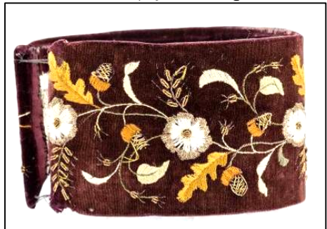
Fig. 5. Borten (nr. inv. 2252 P).

Un Borten cu o puternică influență orășenească din colecția Muzeului ASTRA este cel cu numărul de inventar 2252 P (Fig. 5), provenit din Gușterița 13 , județul Sibiu. Cilindrul scund din