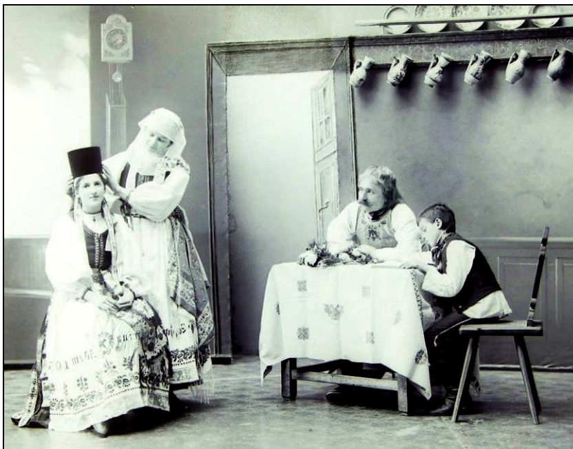
Fig. 2. Gătirea fetei cu Borten , Sibiu, începutul secolului al XX-lea.