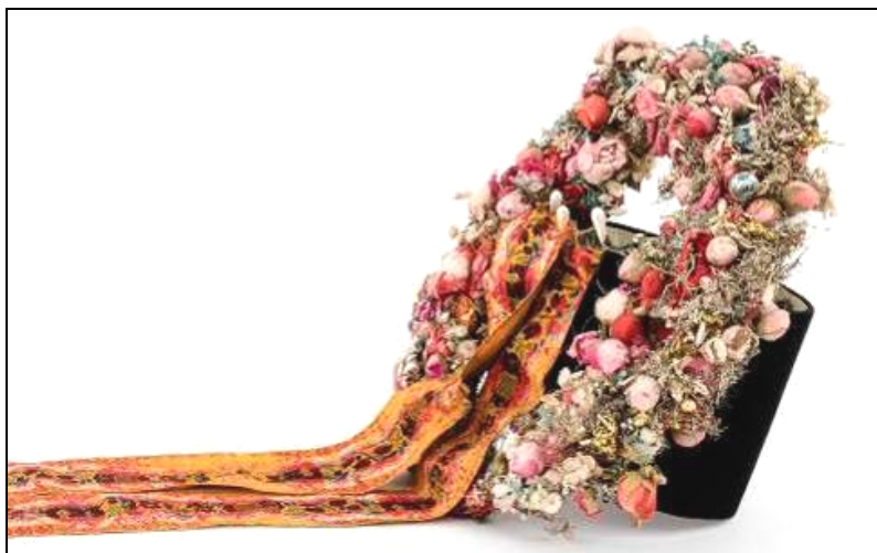
Fig. 16. Borten (nr. inv. 7006 P). Vedere laterală

Nu putem să nu admirăm eleganța cu care cele mai iubite flori își fac apariția în decorarea acestei podoabe: trandafiri maturi, boboci proaspăt înfloriți și bobocei, bujori, campanule, panseluțe, nu-mă-uita, floare de colț, gerbera, maci, lămâițe, lăcrămioare, mazăriche etc., completate de crenguțe și frunze variate. Alături de ele, oferind sclipiri și jocuri cromatice aparte, globulețe aurii, argintii și roșii, beteală și fire metalice, completează extravaganța elevație. Deși astăzi culoarea este mult estompată de trecerea timpului, ne putem imagina impactul vizual cromatic fabulos pe care această coroană și, nu în ultimul rând, posesoarea sa îl vor fi avut asupra privitorului. Nuanțele de auriu, argintiu, alb, bej, galben, degradeuri de la roz pudrat la ciclame, de la orange la roșu aprins, de la verde deschis la verde smarald, albastru ceruleu până la albastru cobalt, mov, sunt puse în valoare de texturile diferite ale materialelor utilizate: fine, rugoase, cărnoase, lucitoare (Fig. 16).