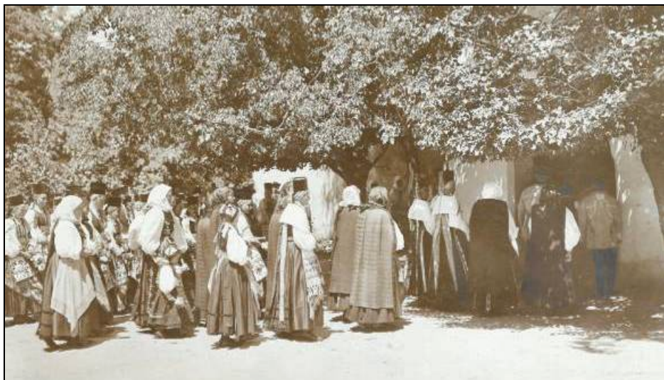
Fig. 4. Intrarea în Biserica Evanghelică din Gușterița, județul Sibiu, 1909.

Ce putem deduce din această poveste este că acțiunea se petrece în cetatea Bistriței, plasarea în timp fiind asociată cu invaziile turcești. Eroina este o fată tânără, nemăritată, cu calități morale și spirit civic ireproșabile. Obiectul salvator, toba, este ridicat la rang de cinste în dansul ritualic al fetelor de dinaintea Lunii juraților prin purtarea pe cap a cilindrului negru – forma Bortenului . Nu știm cât de veridică este această istorioară De când poartă fetele în zona Bistriței Bortenul , publicată de istoricul sas Viktor Roth în anul 1894 10 , dar cu siguranță cilindrul negru este o piesă pe care o regăsim în portul tuturor fetelor săsoaice nemăritate din zona Transilvaniei (Fig. 4).