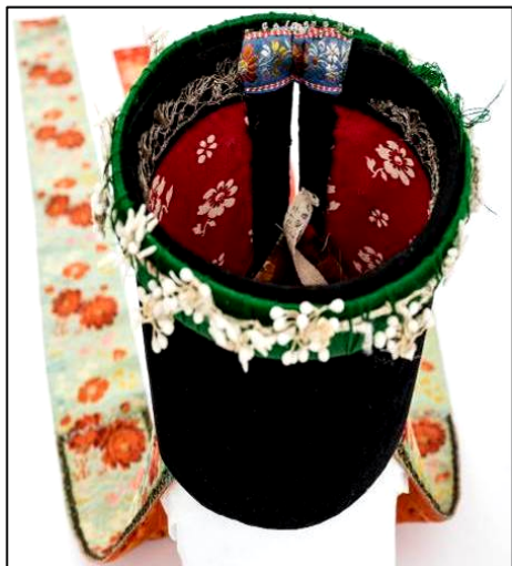
Fig. 20. Borten (nr. inv. 2567 P). Vedere de sus – cilindru închis complet

În cele mai multe cazuri analizate întâlnim similitudini tehnice de prindere a dantelei, combinație de cusătură oblică și înaintea acului cu fir textil subțire alb, bej. În cazul Bortenului de Gușterița, dantelele sunt cusute mecanic. La final, capetele înguste ale catifelei sunt pliate spre interiorul cilindrului, unde sunt cusute de căptușeală. Constatăm în unele cazuri o cusătură neglijentă, uneori chiar grosieră, atât ca tehnica și fir, iar în altele o atenție sporită în execuția îmbinării și a decorării.