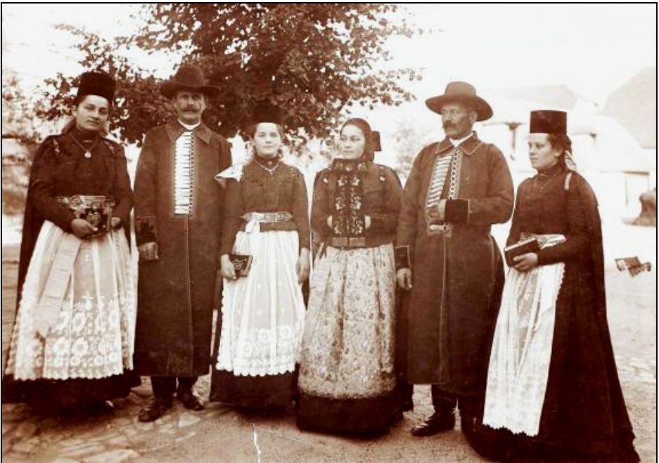
Fig. 7. Grup de sași din Hărman, județul Brașov, începutul secolului al XX-lea. Se remarcă Bortenul mai scund cu panglicile late, în cazul fetelor confirmate.

În zona Țării Bârsei, Bortenul (dial. săsesc Böertchen ) este mai scund față de alte zone etnografice. Ca semn distinctiv prezintă în general atașate la spate fie două panglici de catifea neagră mai late, brodate cu fir metalic auriu, fie panglici de mătase brodate cu motive florale. Panglicile sunt încrucișate în partea de sus și fixate la spate cu ace. Părul împletit în două cozi era prins în formă de coroană în creștetul capului 15 (Fig. 7).