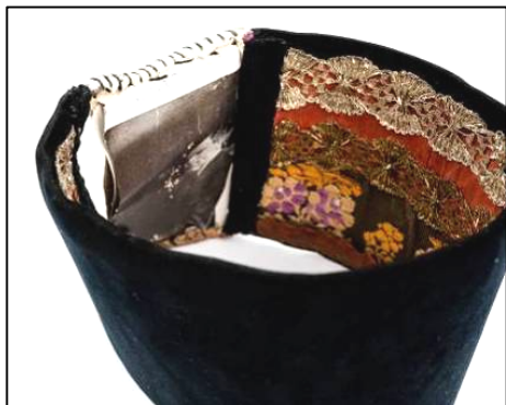
Fig. 19. Borten (nr. inv. 11148 P). Detaliu – dantelă metalică

Pentru a masca metoda de ancorare din partea inferioară, în unele cazuri aceasta este acoperită cu bandă textilă sau vinilin, dublă sau simplă, decupată cu zimți sau cu arcade zimțate. Banda este fie lipită, fie cusută manual cu punct oblic.