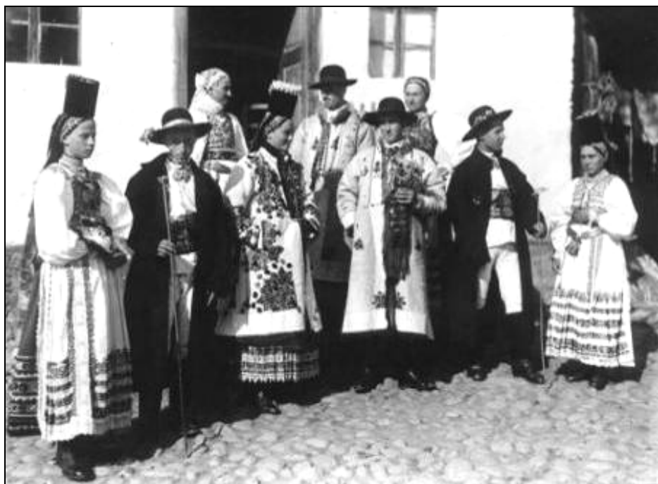
Fig. 8. Miri și nuntași în costum de sărbătoare, din Dumitrița, județul Bistrița-Năsăud, începutul secolului al XX-lea.

În zona Bistriței Bortenul este tratat diferit prin abordarea stilistică și de formă, care fac recunoscutibilă apartenența de zona etnografică. Acesta are un diametru mai îngust decât în celelalte regiuni, uneori fiind chiar mai înalt și este de cele mai multe ori împodobit la spate și pe buza superioară cu mărgelile, dantele sau elemente mărunte de decor. La spate sunt prinse panglici bogate, multicolore. De specificat este faptul că panglicile de spate sunt parte componentă distinctivă identitară a Bortenului de Bistrița, fiind mai late, mai bogate, mai colorate și deosebite prin formă și estetică de restul pieselor din Transilvania. Bortenul se purta puțin înclinat spre frunte (Fig. 8).