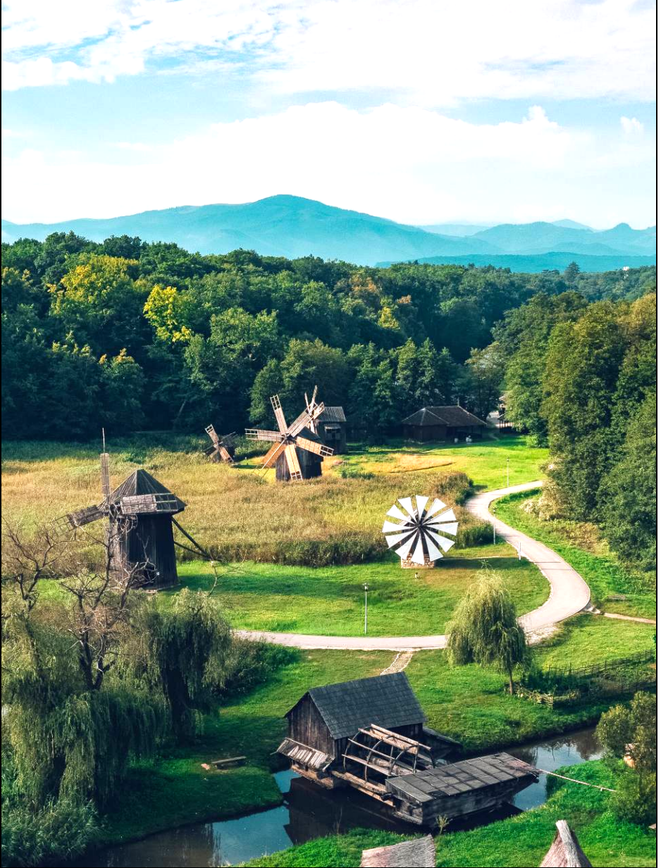
Muzeul în aer liber din Dumbrava Sibiului