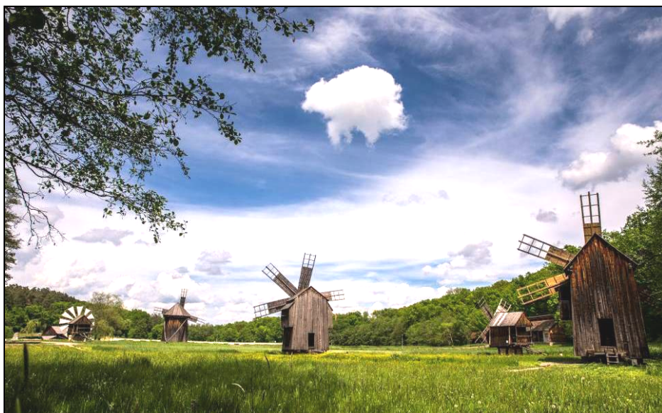
Muzeul în aer liber din Dumbrava Sibiului