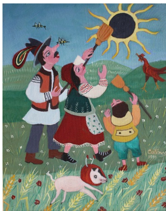
Fig. 12. Catinca POPESCU, „Eclipsa”.