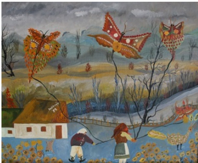
Fig. 9. Despina MITROFAN, „Fluturi”.