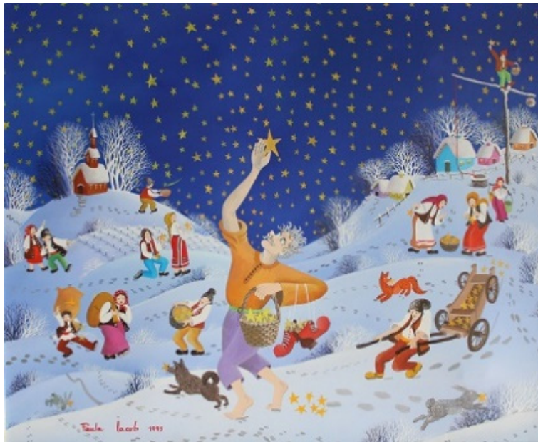
Fig. 14. Paula IACOB, „Culegătorul de stele”.