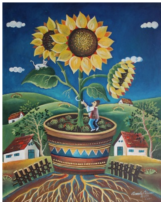
Fig. 11. Aurora NĂFORNIȚĂ, „Primăvara”.