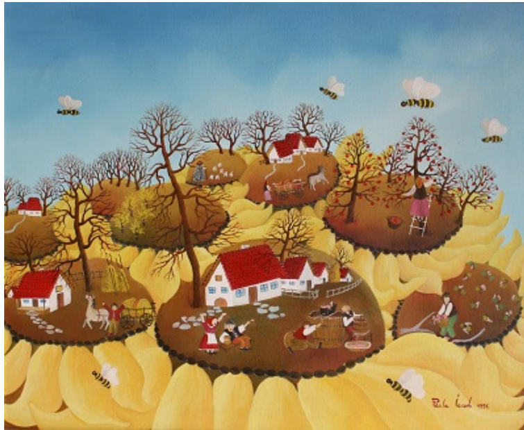
Fig. 13. Paula IACOB, „Floarea Soarelui”.