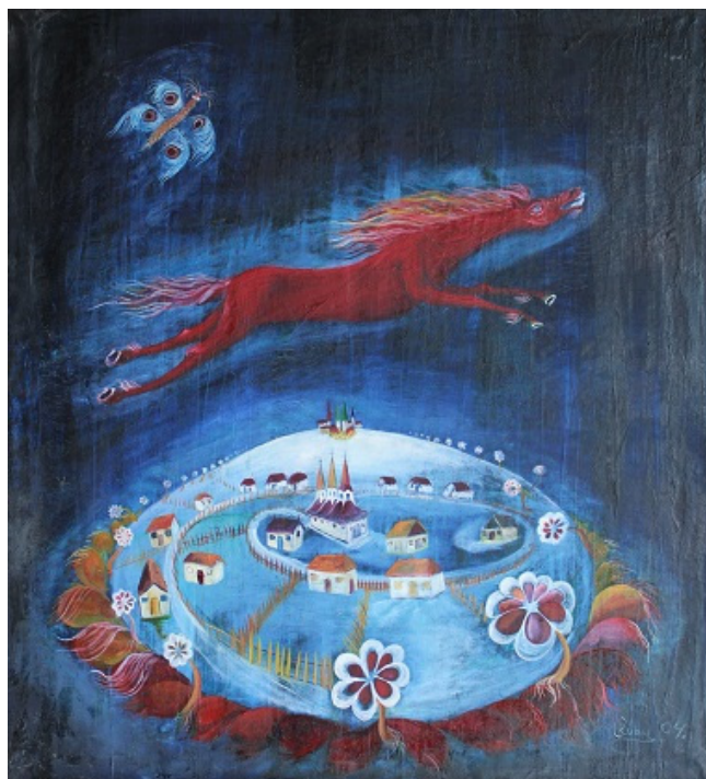
Fig. 7. Calistrat ROBU, „Calul năzdrăvan”.