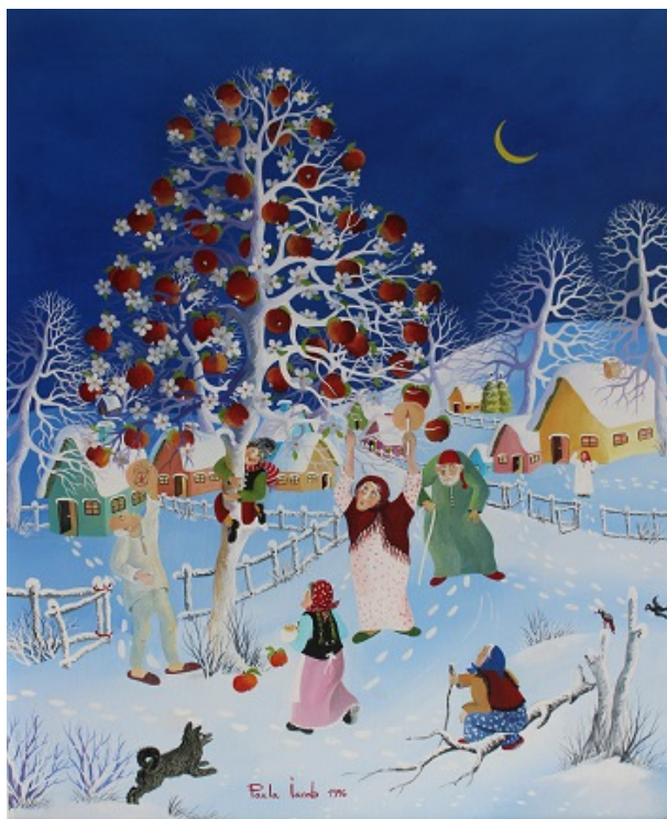
Fig. 10. Paula IACOB, „Mărul de aur”.