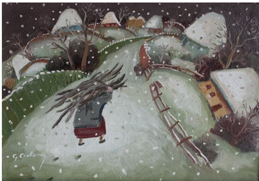
Fig. 8. Georghe CIOBANU, „Povara lemnelor”.