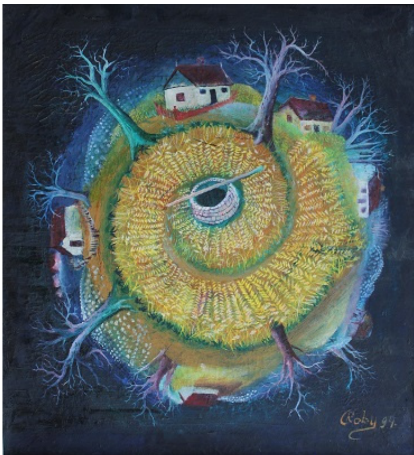
Fig. 15. Calistrat ROBU, „Centrul satului”.