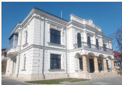
Fig. 1 Muzeul „Vasile Pogor” după restaurare