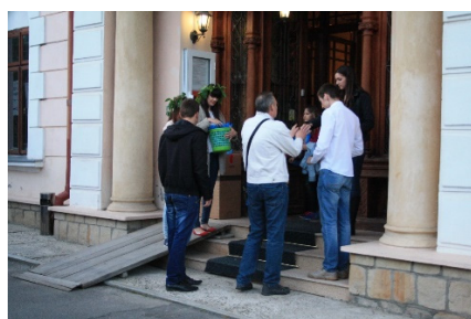
Fig. 2 Calea de acces înainte de restaurare