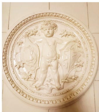
Fig. 12 -13 Sobă și detaliu decorative din interiorul muzeului