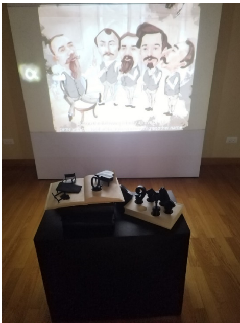
Fig. 4. Sala interactivă