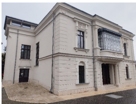
Fig. 3 Calea de acces după restaurare