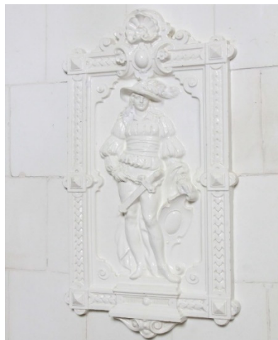
Fig. 14 -15 Sobă și detaliu decorative din interiorul muzeului