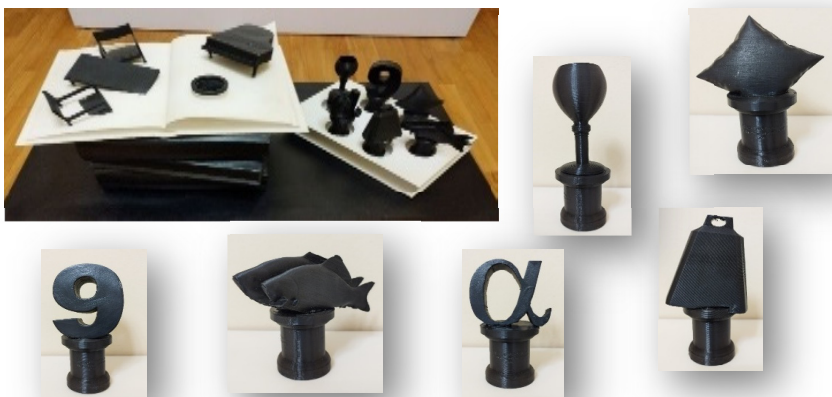
Fig. 5 Dispozitiv din sala interactivă - detaliu