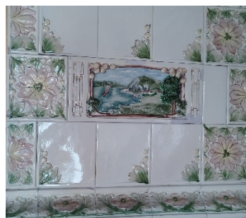
Fig. 8 -9 Sobă și detaliu decorative din interiorul muzeului