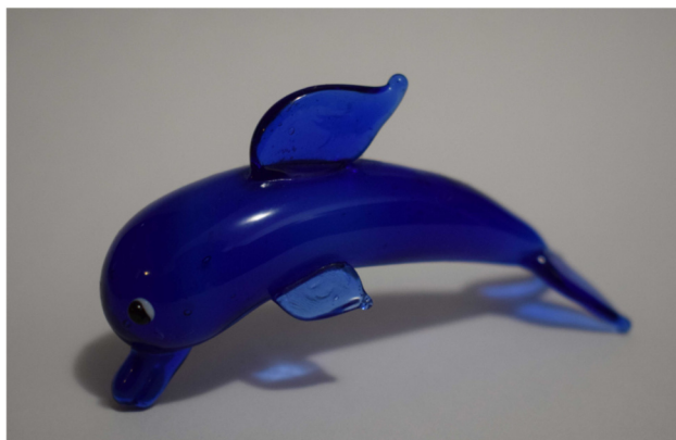
Fig. 9. Delfin din sticlă „Oceanografic”, Valencia (Spania)

Dezvoltarea conceptului de „storytelling” în mediul muzeal poate, în cazul acestei teme, să pornească de la bine-cunoscuta poveste „Peștișorul de aur”. Lectura unei astfel de scrieri fantastice pentru generațiile mai tinere va putea face trecerea către înțelegerea deceniilor trecute prin intermediul acestor artefacte de sticlă, cu varietatea lor policromă aproape infinită. De altfel, respectiva temă are adresabilitate tuturor categoriilor de vârstă.