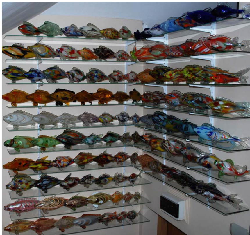
Fig. 4. Pește de sticlă descoperit la Czarnków (Polonia) (apud Litwinowicz, Małgorzata, op. cit. , fig. 91)

În acest material ne propunem o mică radiografie a apariției și dezvoltării acestui motiv al artei de masă, produs de către meșterii sticlari români, făcând apel la presa scrisă.