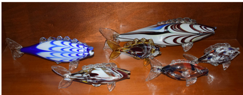
Fig. 7. Pești de sticlă produși la Dorohoi și păstrați în vitrina unei sătence dintr-un sat din apropierea centrului de sticlărie. Aranjamentul pentru fotografie aparține autorului