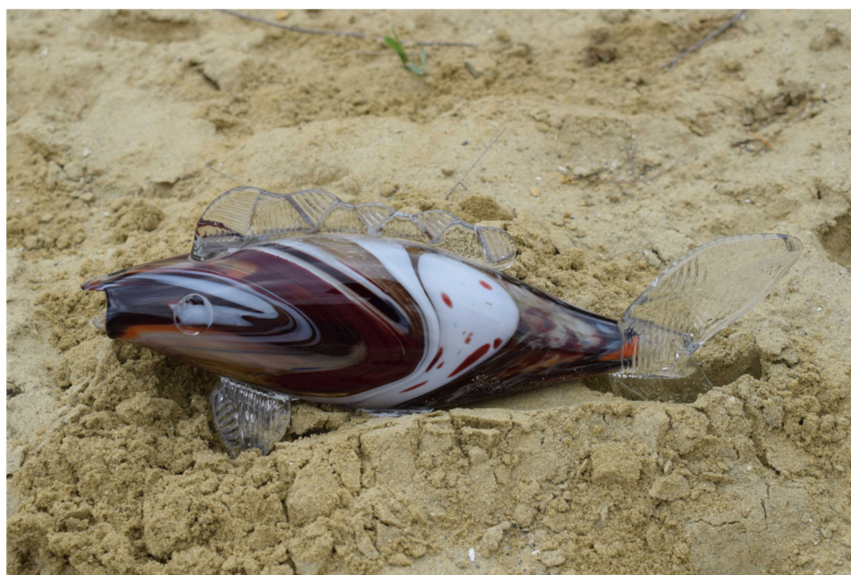
Fig. 8. Pește din sticlă produs la Dorohoi, fotografiat într-o groapă de nisip cuarțifer aflată la 15 km nord-vest de oraș (foto autor)

Nu este exclus ca peștele de sticlă să fi ajuns pe filiera meșterilor sticlari din spațiul central-european (Boemia) ori adriatic (Murano-Veneția). Un asemenea obiect, ce putea fi lesne asociat cu simbolul creștin, a putut fi integrat cu destulă ușurință în societatea românească. De altfel, tehnica modelării figurinelor zoomorfe