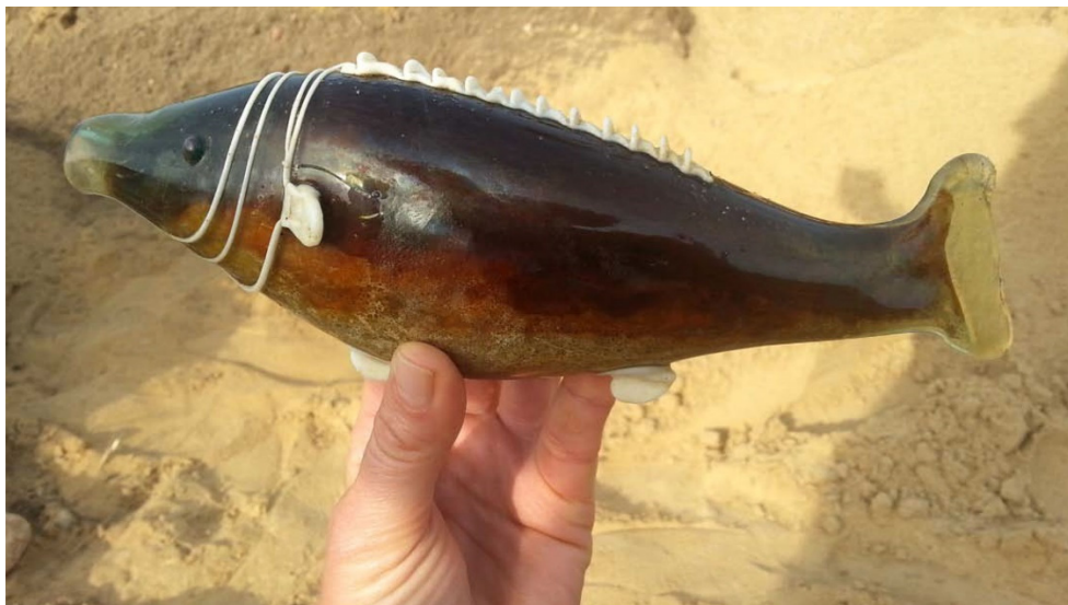
Fig. 3. Pește de sticlă descoperit la Czarnkówek (Polonia) (apud Andrzejowski, Jacek; Krzysiak, Agnieszka; Schuster, Jan; op. cit., fig. 9)

prilejul săpăturilor arheologice, în mormântul unei tinere a fost un pește din sticlă. Descoperirea funerară a fost datată în secolele II-III p. Chr. 6 (Fig. 3). Piesa se află în Muzeul din Leborg, fiind inclusă în expoziția permanentă. Plecând de la această descoperire, într-un studiu cu caracter sociologic, istoricul Małgorzata Litwinowicz făcea referire la diversele colecții de pești de sticlă realizați în importante fabrici de profil din Polonia anilor '70-'80 (Krosno, Dąbrowa Górnicza, Ząbkowice) 7 .