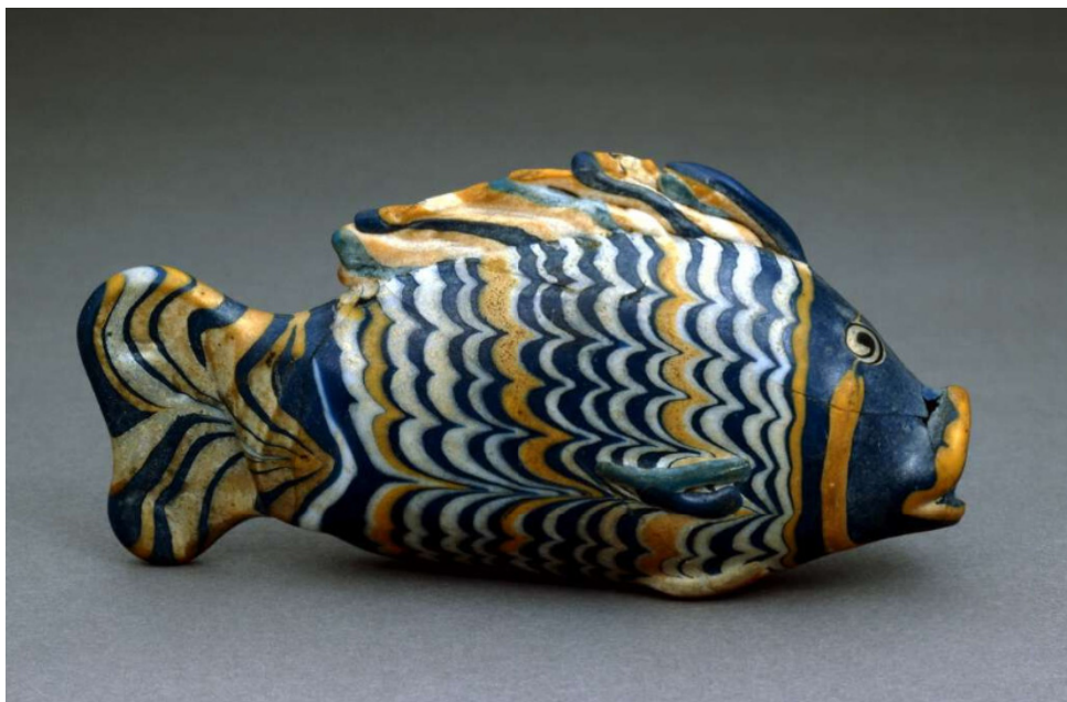
Fig. 1. Vas de sticlă descoperit la El-Amarna (apud https://www.britishmuseum.org/collection/object/Y_EA55193 )

producerea ei de către artizani specializați 1 . Vase de sticlă ichtiomorfe descoperim în Egiptul faraonilor. Un astfel de recipient a fost scos la lumină în timpul unor săpături de la El-Amarna și aparține perioadei istorice corespunzând dinastiei a XVIII-a (1550/1549–1292 a. Chr.). Piesa se păstrează la British Museum din Londra 2 (Fig. 1).