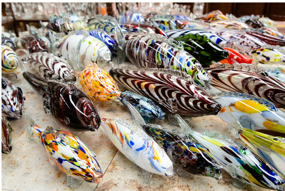
Fig. 5. Colecție de pești de sticlă produși în România (apud https://www.allorigine.it/peste_de_sticla/ )

Vă spun sincer că eu n-aș pune așa ceva în casă pentru nimic în lume. Sunt de un gust cu totul îndoielnic și de asta nu-i cumpără nimeni. În schimb, după câte am auzit, așa ziși artizani lucrează de zor la o nouă serie... 11 .