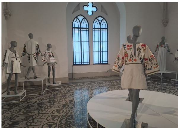
Figura 11 Aspect de la Romanian Creative Week. Palatul Culturii, mai 2023.