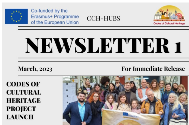
Figura 1 Primul newsletter. Pe copertă, participanții la prima întâlnire de proiect desfășurată la București în martie 2023.