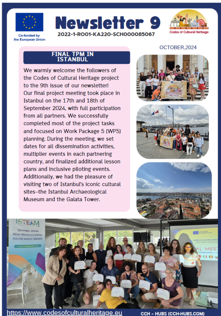
Figura 3 Ultimul newsletter. Imagini cu participanții la ultima întâlnire de la finalul proiectului, desfășurată în septembrie 2024 la Istanbul.