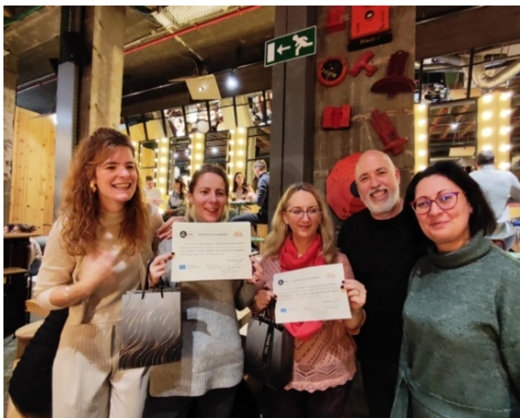
Figura 2 Participanți la cea de-a doua activitate de învățare desfășurată la Bruxelles în decembrie 2023.