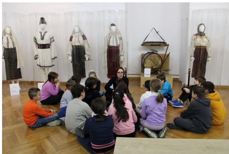
Figura 12 Atelierele de educație muzeală desfășurate la Palatul Culturii contribuie la înțelegerea importanței patrimoniului și a diferitelor sale forme de manifestare.