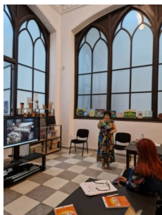
Figurile 16 - 17

Imagini de la cel de-al doilea eveniment de diseminare organizat în iunie 2024 în cadrul Complexului Muzeal Național „Moldova” cu participarea profesorilor de istorie din județul Iași.