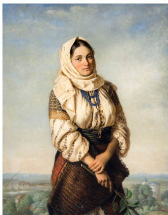
Figura 10 Constantin D. Stahi, „Tânăra țărăncă” (1882), Muzeul de Artă Iași.