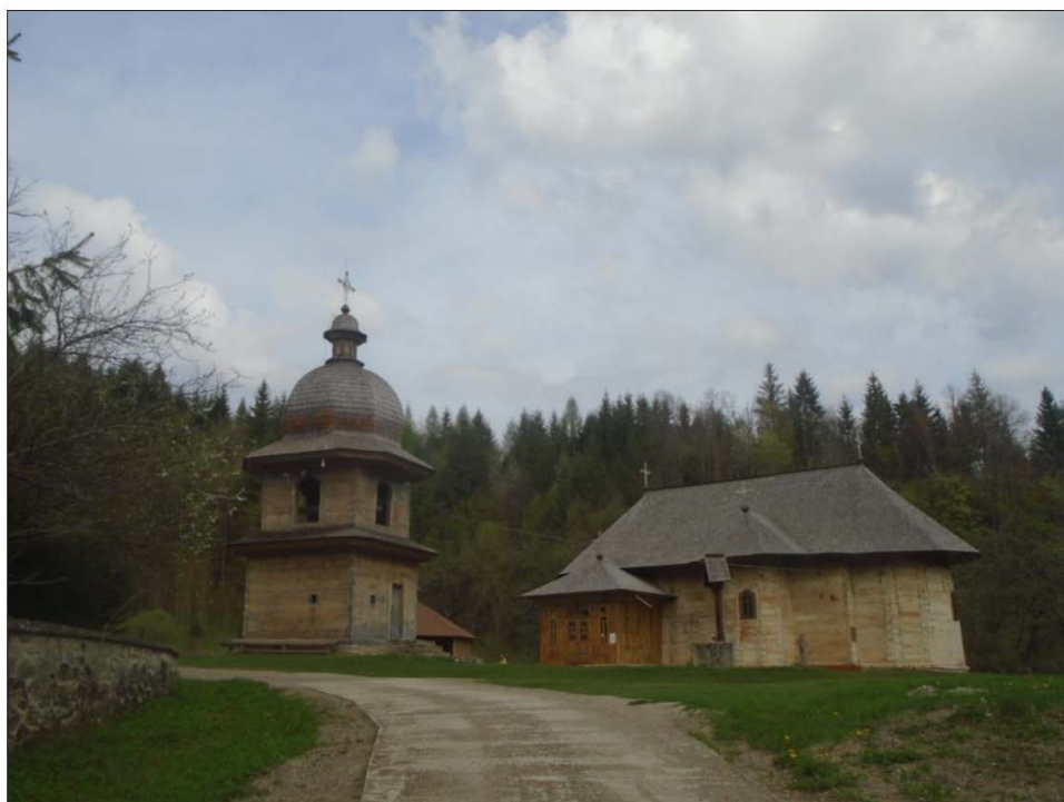
Fig. 1. Clopotnița și biserica Schitului Tarcău

ANIC, Fond Achiziții noi, MMCCCXCVI/1, f. 26v.-27v. Original.