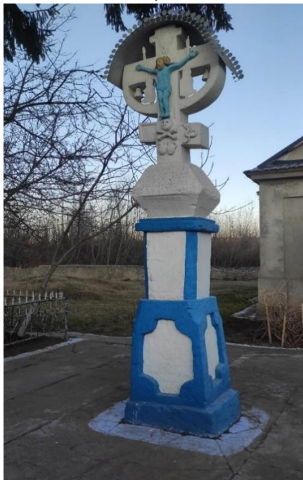
Fig. 2. Troița din curtea bisericii „Sfinții Arhangheli Mihail și Gavril”