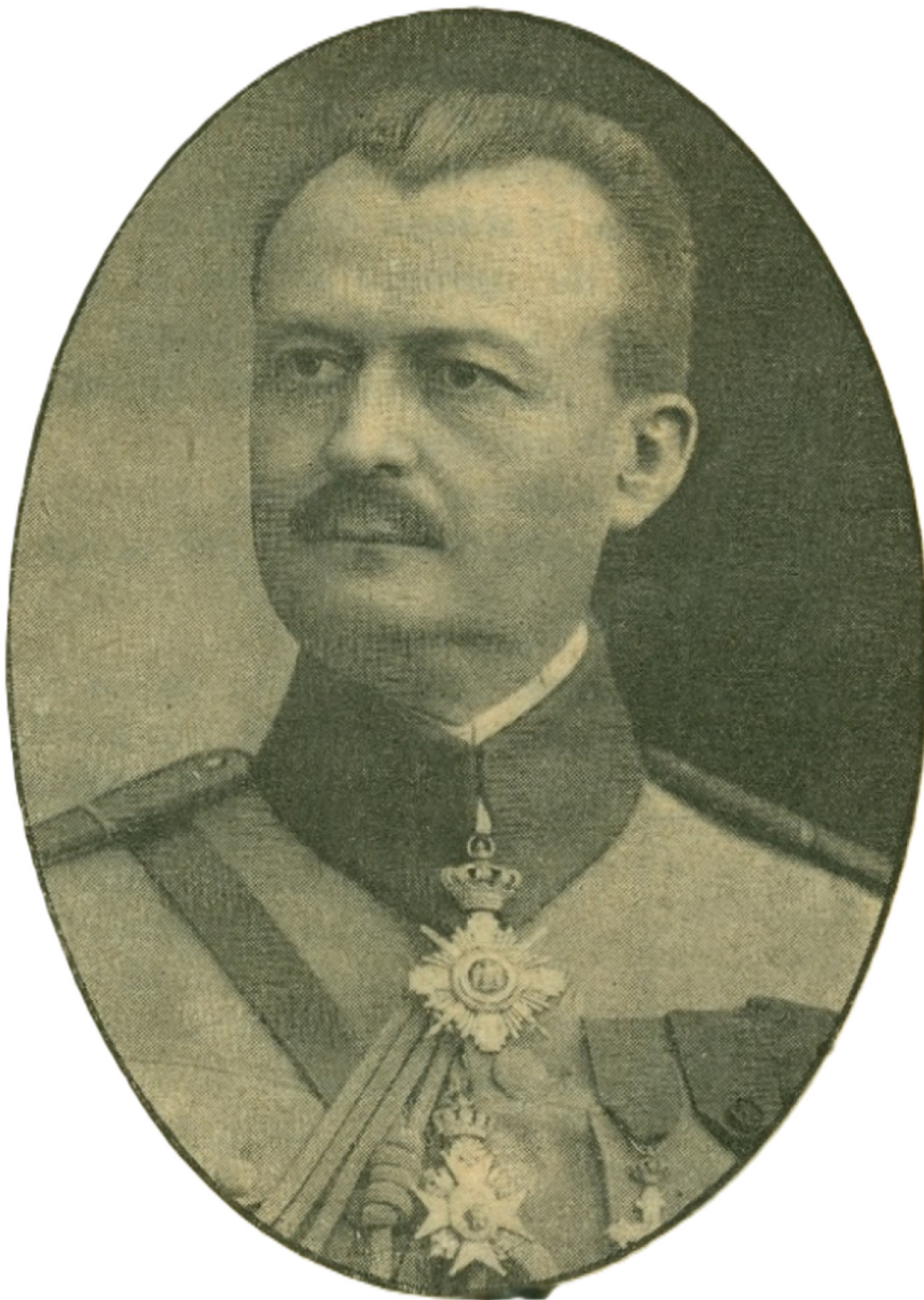
Fig. 4. Generalul Henri Cihoski